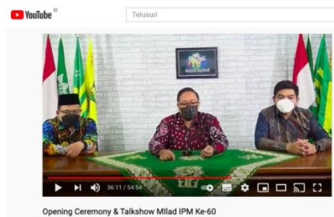
Gambar 2. Pelaksanaan Kegiatan PPM melaluiKanal Youtube Muchild TV https://www.youtube.com/watch?v=gjQHLfrNQD0

Kontribusi Mitra terhadap pelaksanaan diantaranya memberikan masukan-masukan terkait kondisi dan apa yang dibutuhkan oleh IPM SMP Muhammadiyah 2 Yogyakarta. Mitra juga memfasilitasi dalam pembuatan flyer di media sosial, mengundang pimpinan PDM Kota Yogyakarta, serta memberikan fasilitas pelaksanaan PPM di studio Muchild TV. Pemanfaatan hasil PPM dalam integrasi dalam pembelajaran pada prodi yaitu dapat mengimplikasikan teori teori berkaitan dengan peningkatan kompetensi peserta didik diantaranya mata kuliah pengembangan pribadi konselor, komunikasi interpersonal, Perkembangan peserta didik, serta layanan bimbingan dan konseling karir.