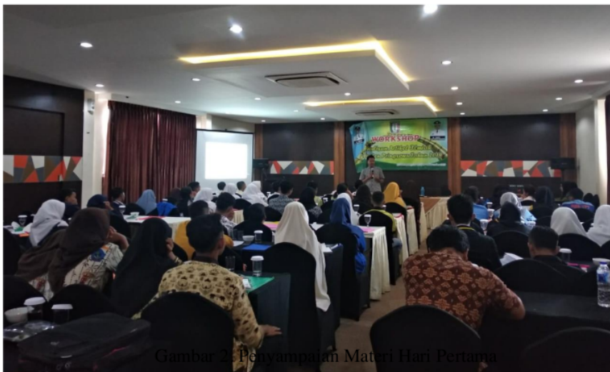
Gambar 2. Penyampaian Materi Hari Pertama

batang tubuh dan isi dari setiap bagian tubuh dalam sistematika artikel. Sesi kedua ini juga disambut dengan sangat antusias oleh peserta. Peserta terlibat aktif melalui berbagai pertanyaan setelah pemateri memaparkan slide materinya. Beberapa pertanyaan tersebut diantaranya: bagaimana cara menyajikan laporan penelitian yang jumlah halamannya seratusan lembar lebih menjadi hanya delapan atau duabelas halaman saja? Apakah semua hasil penelitian dibuat dalam satu artikel? Apakah hasil laporan penelitian kita dapat dibuat lebih dari satu artikel? Bagaimana cara mengutip hasil penelitian terdahulu untuk dimasukkan ke artikel kita?