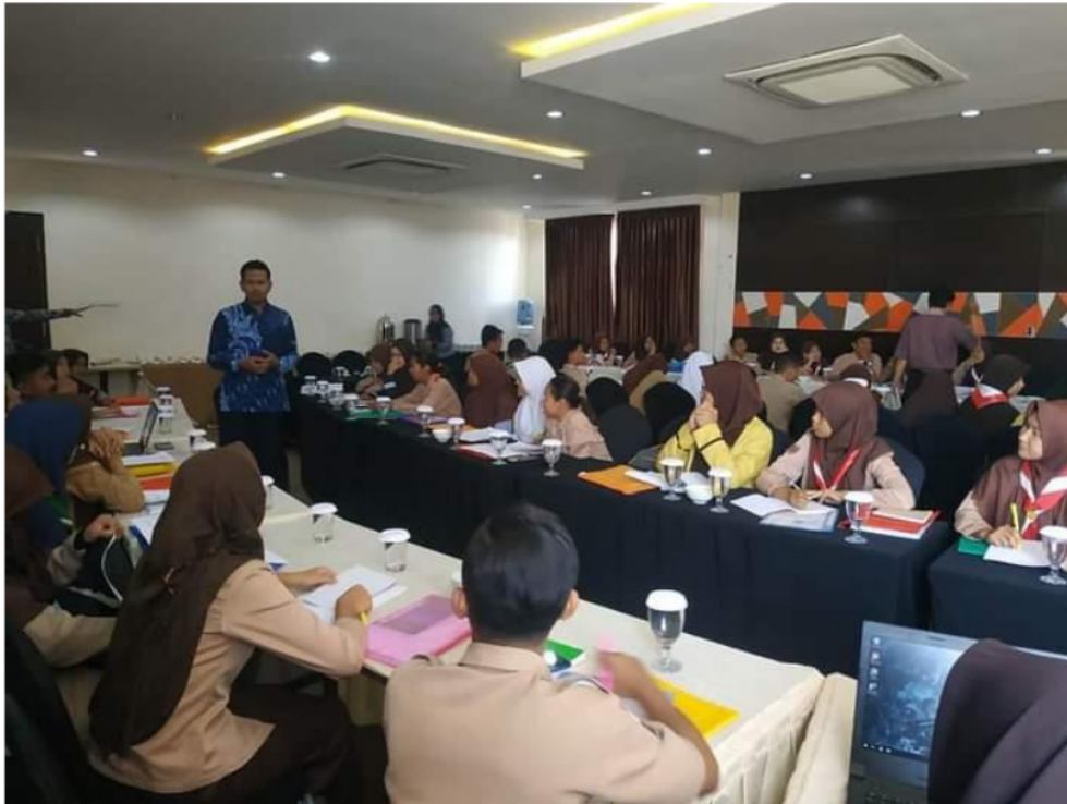
Gambar 3. Klinik Manuscrip Hari kedua

kegiatan juga menjanjikan akan diberikan souvenir bagi lima peserta terbaik, dengan indikator kesiapan artikel untuk dipublikasikan. Reward dari panitia ini cukup berdampak signifikan bagi peserta untuk mempersiapkan draft artikel. Hal ini cukup terlihat dari semangat dan antusiasme peserta untuk mengerjakan tugas membuat draft artikel yang ditugaskan oleh pemateri.