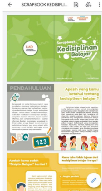
Gambar 3. Media Scrapbook Kedisiplinan Belajar