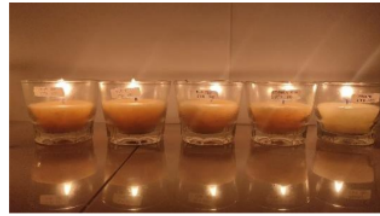
Gambar 7. Lilin dengan 100 gram stearin setelah dibakar

Data hasil uji organoleptik terhadap lilin dengan perbandingan minyak jelantah dan stearin yang digunakan adalah 1:1 yaitu 100 ml minyak jelantah : 100 gram stearin menggunakan 4 variasi perlakuan penyerapan minyak dengan karbon aktif (40 gram, 80 gram, 120 gram, dan tanpa penyerapan) tertera pada Tabel 4.