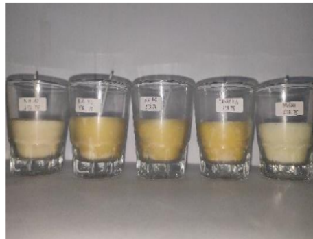
Gambar 4. Variasi massa karbon aktif dan massa stearin

Hasil lilin menggunakan stearin 75 gram dengan berbagai variasi massa karbon aktif disajikan pada Gambar 4 dan Gambar 5.