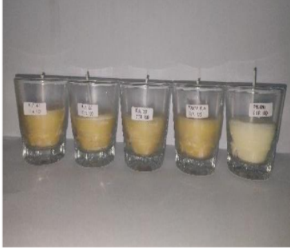
Gambar 6. Variasi karbon aktif

Hasil lilin menggunakan 100 gram stearin dengan berbagai variasi massa karbon aktif disajikan pada Gambar 6 dan Gambar 7.