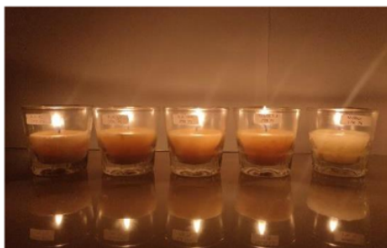
Gambar 5. Lilin dengan 75 gram stearin setelah dibakar

Data hasil uji organoleptik terhadap lilin dengan perbandingan minyak jelantah dan stearin yang digunakan adalah 10:7,5 yaitu 100 ml minyak jelantah : 75 gram stearin dan masih menggunakan 4 variasi perlakuan penyerapan minyak dengan karbon aktif (40 gram, 80 gram, 120 gram, dan tanpa penyerapan) tertera pada Tabel 3.