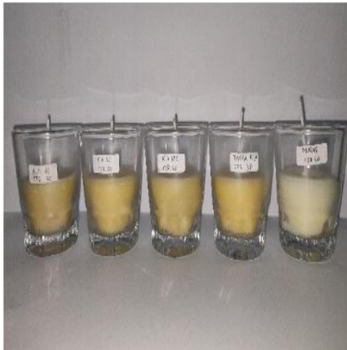
Gambar 2. Lilin dengan 50 gram stearin sebelum dibakar

Hasil lilin menggunakan stearin 50 gram dengan berbagai variasi massa karbon aktif disajikan pada Gambar 2 dan Gambar 3.