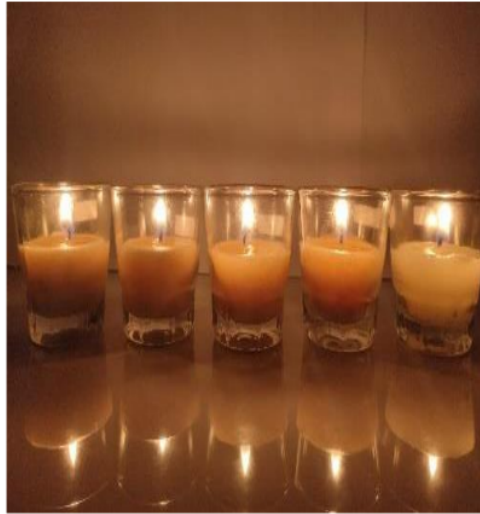
Gambar 3. Lilin dengan 50 gram stearin setelah dibakar

Data hasil uji organoleptik terhadap lilin dengan perbandingan minyak jelantah dan stearin yang digunakan adalah 10:5 yaitu 100 ml minyak jelantah : 50 gram stearin dengan menggunakan 4 variasi perlakuan penjerapan minyak dengan karbon aktif (40 gram, 80 gram, 120 gram, dan tanpa penjerapan) tertera pada Tabel 2.