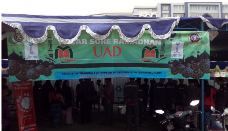
Gambar 8. Pasar Sore Ramadhan 2018