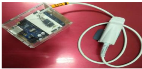
Gambar 1. Fotoğraf modul elektronik Pulse oximeter

Sedangkan pada Gambar 2 ditunjukan sampel sinyal PPG dari dua responden yang diambil.