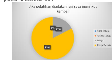
Gambar 13 Kesan Peserta Terhadap Pelatihan Microsoft Word dan PowerPoint

Berdasarkan Gambar 12 sebanyak 4% peserta menjawab Setuju dan 96% peserta menjawab Sangat Setuju bahwa pelatihan ini membuat skill peserta pada Microsoft Word dan PowerPoint meningkat. Hasil selanjutnya ditunjukkan pada Gambar 13.