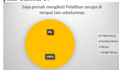
Gambar 3 Grafik Pertanyaan Kedua

Pertanyaan kedua yaitu “Saya pernah mengikuti Pelatihan serupa di tempat lain sebelumnya” pada point ini peserta yang memilih jawaban Sangat Setuju sebanyak 100% hasil ditunjukkan pada Gambar 3.