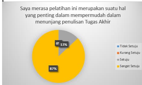
Gambar 4 Grafik Pertanyaan Ketiga

memilih jawaban Setuju sebanyak 13% sedangkan sebanyak 87% peserta memilih Sangat Setuju hasil ditunjukkan pada Gambar 4.