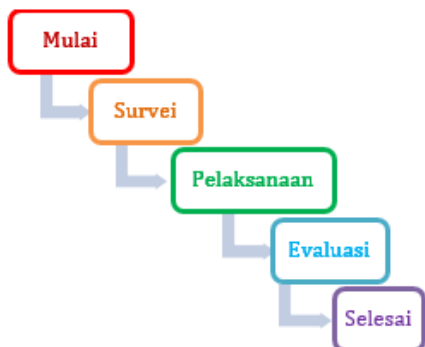
Gambar 1 Alur Pelaksanaan Kegiatan

Surakarta. Peserta yang mengikuti pelatihan ini ialah mahasiswa semester akhir prodi Manajemen Informatika Politama Surakarta berjumlah 23 orang. Supaya lebih mudah dalam proses menganalisisnya kegiatan ini dibagi tiga tahapan, yaitu tahap pra-pelaksanaan (survei), tahap pelaksanaan, dan tahap evaluasi (Fadlil et al., 2022). Alur pelaksanaan kegiatan ini ditunjukkan pada Gambar 1.