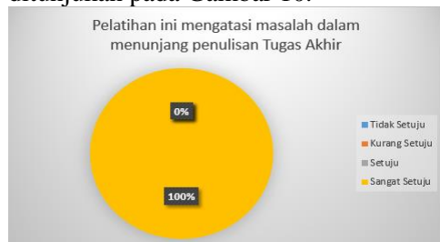
Gambar 10 Kesan Peserta Mengenai Pelatihan

Berdasarkan Gambar 9 sebanyak 100% peserta menjawab Sangat Setuju bahwa kegiatan ini dapat menambah Ilmu/ Wawasan mengenai Microsoft Word dan PowerPoint . Hasil selanjutnya ditunjukkan pada Gambar 10.