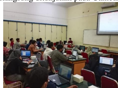
Gambar 8 Pemaparan Materi Sesi Kedua

Dilanjutkan dengan sesi kedua yang dilakukan secara tatap muka atau luring tentang pemaksimalan penggunaan & otomasi Microsoft Word. , sesi kedua disampaikan oleh Izzan Julda D.E Purwadi Putra. Materi yang disampaikan adalah penjelasan Saat sesi kedua berlangsung ditunjukkan pada Gambar 8.