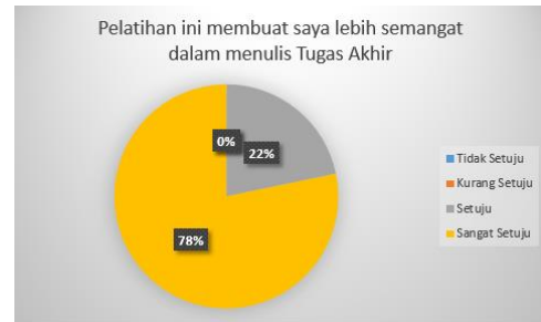
Gambar 11 Pangalaman Peserta Mengenai Pelatihan

akhir. Hasil selanjutnya ditunjukkan pada Gambar 11.