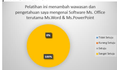
Gambar 9. Wawasan Peserta Mengenai Microsoft Word dan PowerPoint

Setelah pelatihan dilakukan post-test guna mengukur pemahaman peserta terhadap materi yang disampaikan dengan memberikan kuesioner (Ulfa, 2022). Didapatkan hasil yang ditunjukkan pada Gambar 9.