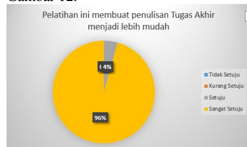
Gambar 12 Kesan Peserta Terhadap Pelatihan Microsoft Word dan PowerPoint

Berdasarkan Gambar 11 sebanyak 22% peserta menjawab Setuju dan 100% peserta menjawab Sangat Setuju bahwa pelatihan ini membuat peserta lebih semangat dalam menulis tugas akhir. Hasil selanjutnya ditunjukkan pada Gambar 12.