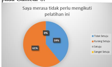
Gambar 6 Grafik Pertanyaan Kelima

Pertanyaan Kelima yaitu “Saya merasa tidak perlu mengikuti pelatihan ini” pada point ini peserta yang memilih jawaban Tidak Setuju sebanyak 19% sedangkan sebanyak 61% peserta memilih Kurang Setuju hasil ditunjukkan pada Gambar 6.