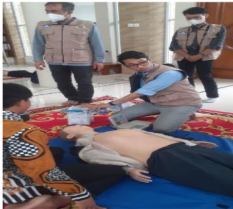
Gambar 2a. Contoh BHD dari tim PKM

3 Pelatihan dapat mempengaruhi pengetahuan secara signifikan karena memiliki faktor pendukung. Salah satu faktor yang membuat pelatihan dengan metode simulasi mampu menambah pengetahuan adalah karena peserta dibimbing langsung oleh trainer yang sudah berpengalaman. Hal ini kami lakukan pada kegiatan PKM ini, dimana penyuluhan dan pelatihan dilakukan berkesinambungan dan langsung dipraktikkan sehingga pelatih segera memberikan koreksi langsung pada semua peserta. Selain itu, peserta bisa langsung bertanya, sehingga peserta lebih paham dalam proses pelatihan.