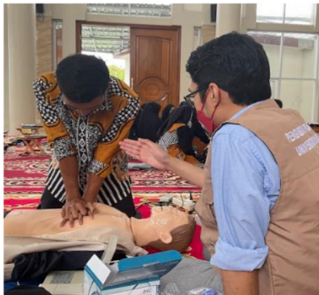
Gambar 2c. Praktek BHD oleh peserta putra