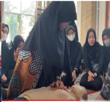
Gambar 2b. Praktek BHD oleh peserta putri