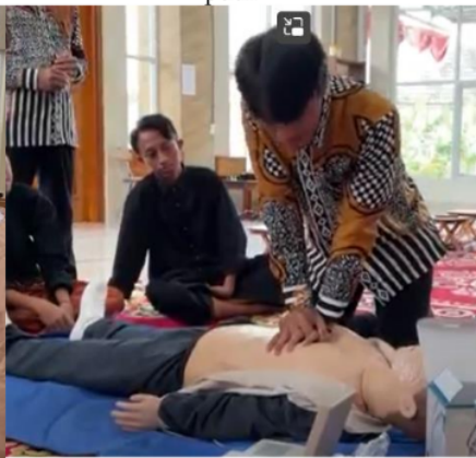
Gambar 2d. Praktek BHD oleh peserta putra