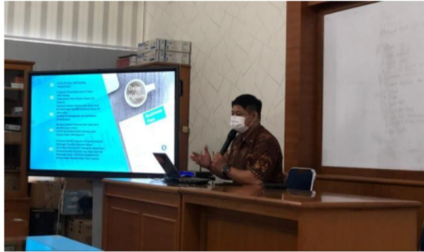
Gambar 4 ToT Kelembagaan dan Usaha Koperasi