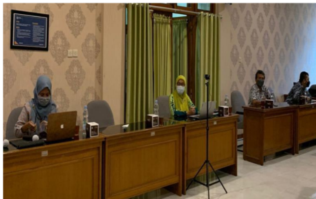
Gambar 2. FGD Penggalan Permasalahan Mitra