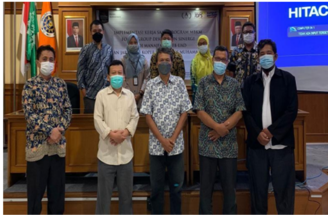
Gambar 1. Implementasi Kerjasama dan FGD Penggalan Permasalahan Mitra