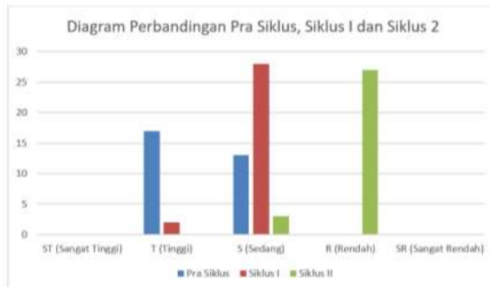
Gambar 1. Diagram Perbandingan Prokrastinasi Akademik Peserta Didik antara Pra Siklus, Hasil Siklus 1 dan Siklus II

Berdasarkan tabel dan digambarkan dengan diagram grafik diatas pada setiap siklusnya peserta didik mengalami pengurangan prokrastinasi akademiknya. dimana pada tahap kondisi awal atau pra penelitian peserta didik dalam kategori tinggi masih terdapat 17 peserta didik, kemudian setelah diberikan tindakan disiklus I kategori sedang telah mengalami penurunan dengan pencapaian terdapat 28 peserta didik. Pada siklus II mengalami penurunan yang signifikan yaitu terdapat 27 peserta didik dalam kategori rendah