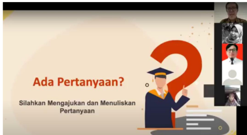
Gambar 3. Sesi Diskusi Pelatihan