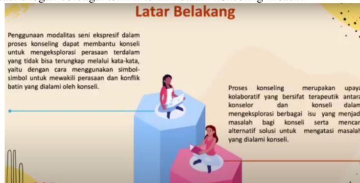
Gambar 2. Sosialisasi Konseling Seni Kreatif pada Konselor Sekolah

Kegiatan berikutnya adalah sosialisasi intervensi melalui layanan konseling dengan seni kreatif. Konselor sekolah dapat mengembangkan diri melalui layanan konseling kreatif untuk membantu siswa yang mengalami kondisi burnout. Konselor sekolah memiliki antusiasme dalam sosialisasi dengan berbagai teknik-teknik dalam konseling kreatif.