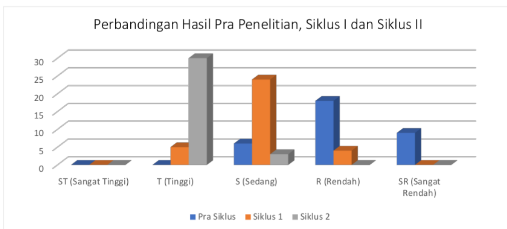
Gambar 1. Diagram Perbandingan Manajemen Waktu Peserta Didik antara Pra Siklus, Hasil Siklus 1 dan Siklus II

peningkatan prosentase sebesar 25%. Maka dapat disimpulkan bahwa siswa kelas X BDP 3 setelah mendapatkan layanan pada tindakan 1 pada siklus 1 dan tindakan 2 pada siklus 2 menunjukkan kategori baik.