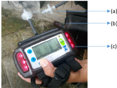
Gambar 3. Sensor gas Dragger X-am 7000 (a) selang/pipa input gas (b) sumber gas (c) layar deteksi gas beracun

Dragger X-am 7000 merupakan alat untuk mengukur kadar gas-gas Gunung Merapi secara in-situ atau kontak yaitu dengan memasukan gas masuk ke dalam tabung vakum yang terdapat pada alat tersebut. Gas-gas yang dideteksi antara lain CH 4 , CO 2 , H 2 S, SO 2 dan CO. Inilah yang menyebabkan sensor gas Dragger X-am 7000 menjadi tidak efektif untuk monitoring aktivitas vulkanik gunung berapi. Dalam pengujian awal tersebut, mesin penghasil gas dinyalakan selama 60 detik kemudian direkam nilai dari masing-masing gas yang dihasilkan. Adapun Hasil yang diperoleh, ditunjukkan pada Tabel 1 .