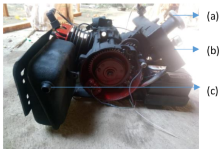
Gambar 2. Mesin 2 tak (penghasil CO 2 ) (a) pengisian bahan bakar (b) starting mesin (c) pipa keluar gas

Penelitian ini merancang sistem deteksi CO 2 dalam skala laboratorium. Sumber gas CO 2 menggunakan replika mesin 2 tak seperti pada Gambar 2. Kelebihan mesin 2 tak adalah lebih ringan, konstruksinya sederhana, dan proses konstruksi mesin yang lebih murah. Pemanfaatan proses dua langkah piston pada saat pembakaran bahan bakar dan udara di dalam ruang pembakaran, sehingga menghasilkan gas buang yang akan dideteksi. Gas yang dikeluarkan oleh mesin ini diuji dengan menggunakan sensor gas Dragger X-am 7000 seperti Gambar 3.