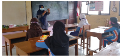
Gambar 1. Penjelasan tentang Ciri Tanaman Dikotil dan Monokotil

Sosialisasi pembuatan herbarium di SDN 3 Jambakan dilaksanakan secara konvensional, yaitu penyampaian materi tentang tanaman dikotil dan monokotil. Penyampaian materi dilaksanakan sebelum proses pembuatan herbarium. Semua siswa mengikuti materi yang disampaikan dengan sungguh-sungguh. Dalam sosialisasi disampaikan kepada siswa tentang ciri-ciri tanaman monokotil dan dikotil (gambar 1). Siswa diminta menyebutkan contoh tanaman dikotil dan monokotil yang ada di sekitar lingkungan mereka tinggal. Kegiatan sosialisasi dan penyampaian materi berdampak pada pengetahuan siswa tentang herbarium, siswa mendapatkan wawasan baru. Sosialisasi herbarium dan penguatan materi monokotil dikotil turut menumbuhkembangkan sikap ilmiah pada siswa seperti rasa ingin tahu dan skeptis.