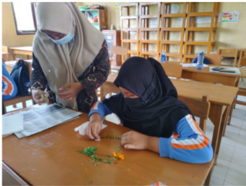
Gambar 2. Membersihkan Bagian Tanaman dengan Alkohol

Setelah dua minggu dikeringkan herbarium siap untuk di bongkar. Siswa sangat antusias dan bersemangat untuk melihat hasil herbarium yang telah mereka buat. Herbarium yang telah dibuat siswa telah kering semua dan hasilnya bagus. Setelah dibongkar herbarium ditempel ( mounting ) pada kertas karton putih menggunakan lem (Gambar 3). Proses mounting disusul dengan proses labelling. Setelah semua proses selesai herbarium siswa dibingkai menggunakan mika bening dan lakban (Gambar 4). Siswa kelas 6 SDN 3 Jambakan sangat senang dengan herbarium yang telah mereka buat.