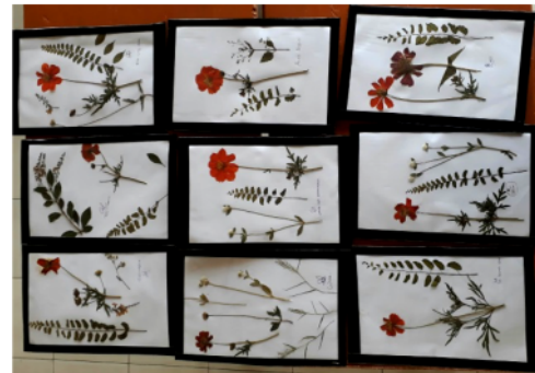
Gambar 4. Herbarium yang Sudah Jadi dan Telah dibingkai