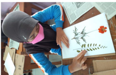
Gambar 3. Proses Penempelan Herbarium Pada Kertas ( Mounting )

Setelah dua minggu dikeringkan herbarium siap untuk di bongkar. Siswa sangat antusias dan bersemangat untuk melihat hasil herbarium yang telah mereka buat. Herbarium yang telah dibuat siswa telah kering semua dan hasilnya bagus. Setelah dibongkar herbarium ditempel ( mounting ) pada kertas karton putih menggunakan lem (Gambar 3). Proses mounting disusul dengan proses labelling. Setelah semua proses selesai herbarium siswa dibingkai menggunakan mika bening dan lakban (Gambar 4). Siswa kelas 6 SDN 3 Jambakan sangat senang dengan herbarium yang telah mereka buat.