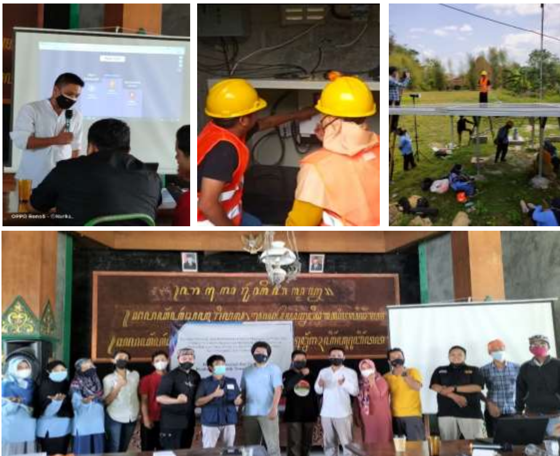
Gambar 5. Dokumentasi kegiatan pelatihan operasional dan pemeliharaan PLTS

Setelah paparan materi operasional dan pemeliharaan PLTS serta pelatihan lapangan, kegiatan pengabdian ini diakhiri dengan pemberian post-test untuk menguji efektivitas penyampaian materi dan pelatihan lapangan. Pengetahuan peserta tentang