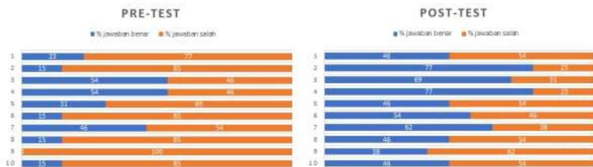
Gambar 4. Persentase jawaban benar pada saat pre-test dan post-test

Tingkat pemahaman peserta terkait pengoperasian dan pemeliharaan PLTS grid-tie utility scale diukur dengan menggunakan pre-test dan post-test yang masing-masing berisi 10 pertanyaan. Gambar 4 menunjukkan grafik persentase jawaban benar untuk 10 pertanyaan pre-test dan post-test yang dijawab oleh peserta kegiatan. Dari data tersebut terlihat bahwa pengetahuan dan pemahaman peserta meningkat secara signifikan. Adapun nilai skor akhir dari pre-test dan post-test peserta terkait pengoperasian dan pemeliharaan PLTS grid-tie utility scale dengan mempertimbangkan faktor waktu diberikan pada Tabel 1. Dari hasil pre-test terlihat bahwa pengetahuan peserta tentang operasional dan pemeliharaan PLTS masih tergolong rendah dengan skor rata-rata sebesar 2278. Dari hasil pre-test juga terlihat bahwa sebaran pengetahuan peserta juga masih beragam, terlihat dari perbedaan skor maksimum sebesar 4060 dan skor minimum sebesar 1644, atau jika dinyatakan sebagai standar deviasi sebesar 803. Setelah pre-test , kegiatan kemudian dilanjutkan dengan penyampaian materi operasional dan pemeliharaan PLTS serta pelatihan lapangan tentang pemeliharaan PLTS. Gambar 5 menunjukkan kegiatan penyampaian materi dan pelatihan lapangan tentang operasional dan pemeliharaan PLTS grid-tie utility scale di Desa Serut.