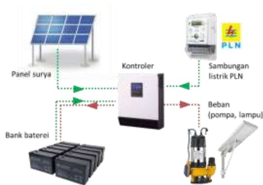
Gambar 1. Skema PLTS grid-tie 5.000 Watt-peak di Serut, Gedangsari, Gunung Kidul