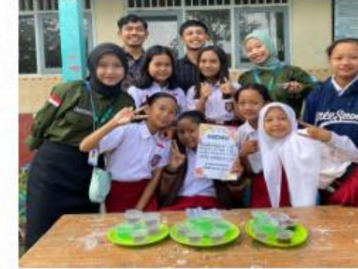
Market Day di SDN Pakis Pati, Jawa Tengah