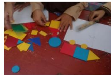
Media ajar permainan geometri di SD Negeri Cangkring 03, Bandung, Jawa Barat