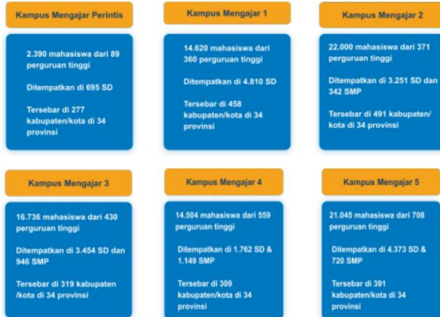
Gambar 1.1. Perkembangan Program Kampus Mengajar