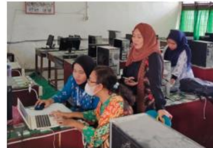
Pembuatan media pembelajaran bersama guru di SMP Negeri 2 Rantau Selatan, Labuhanbatu, Sumatera Utara