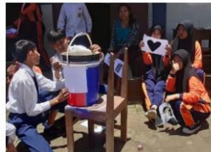
Pembuatan tempat sampah dari ember bekas di SMP PGRI Jabung, Malang, Jawa Timur