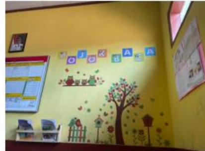
*Pojok baca di SD Negeri Cangkring 03, Bandung, Jawa Barat