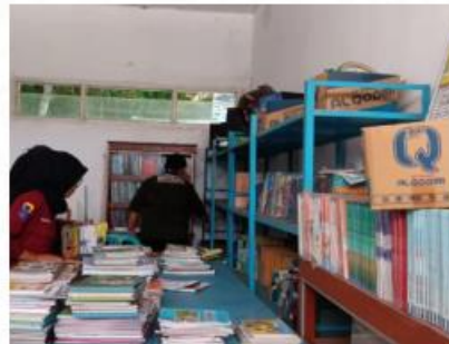
Sortir buku layak baca di SMP Islam Riyadlus Sholihien, Jember, Jawa Timur