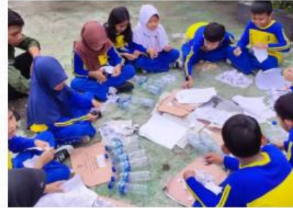
Pembuatan Ecobrick di SDN Ngabeyan 01 Wonogiri, Jawa Tengah