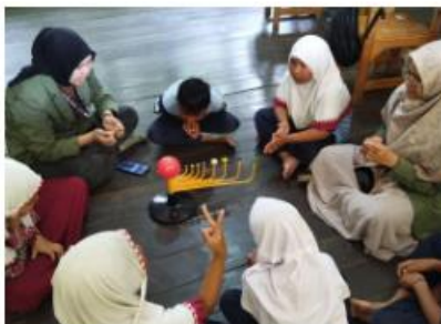
Literasi sains di SDN Banua Hanyar 1 Hulu Sungai Utara, Kalsel