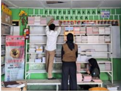
Penataan Perpustakaan di SDN 71 Makassar, Sulawesi Selatan