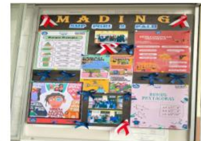
Pengelolaan mading di SMP PGRI 2 PALU Kota Palu Sulawesi Tengah