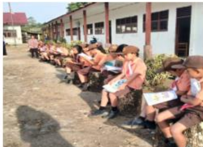
Membaca sebelum KBM di SDN 177669 Aek Godang, Humbahas, Sumatera Utara