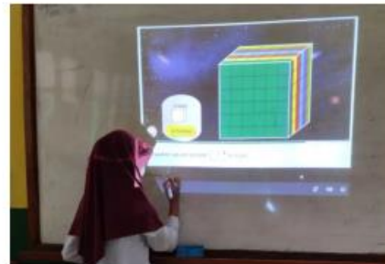
Pembelajaran numerasi menggunakan game di SDN Drawati 01, Bandung, Jawa Barat