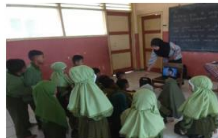
Belajar melalui video edukasi di SDN 3 Karang Sari, Malang, Jawa Timur