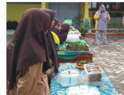
Bazar makanan tradisional Bima, di SDN 39 Raba Dompus Barat, Bima, NTB