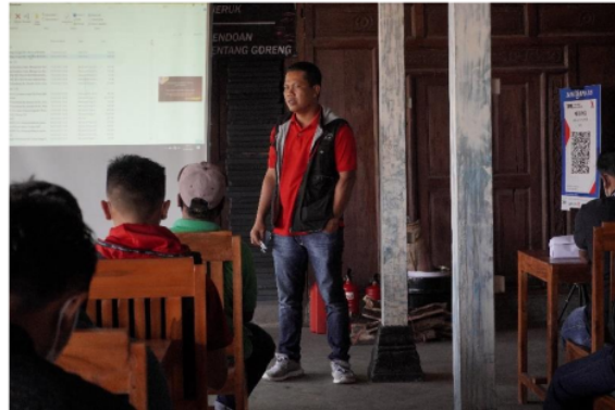
Gambar 2. Sambutan oleh Pimpinan Pengelola objek wisata tebing breksi

Kegiatan pelatihan merupakan salah satu bentuk kegiatan pengabdian kepada masyarakat. Kegiatan ini dilakukan dengan cara membekali pengelola objek wisata tebing breksi dengan kemampuan teori dan praktik pemadaman kebakaran. Kegiatan pelatihan ini diikuti oleh 20 peserta dan dibuka secara langsung oleh pimpinan atau ketua pengelola objek wisata tebing breksi.