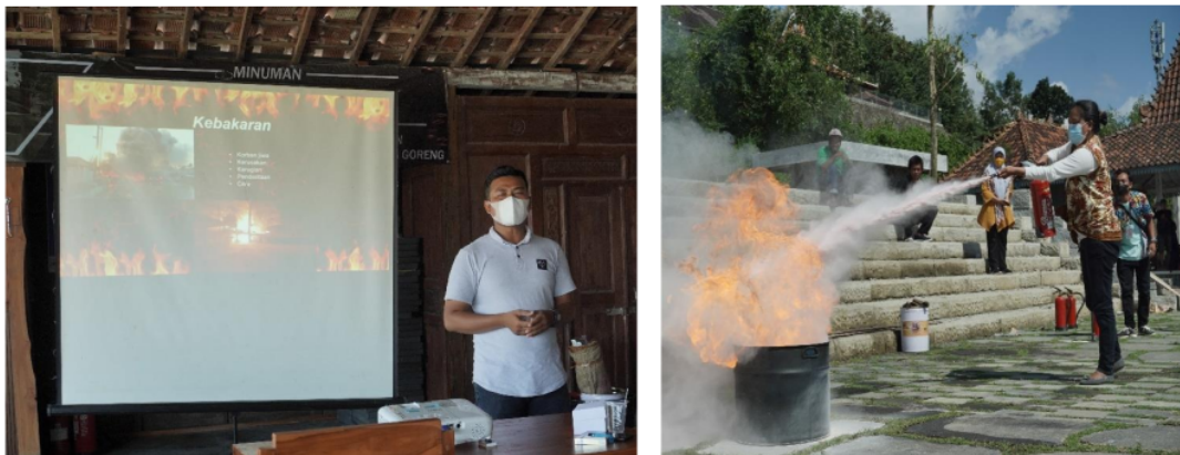
Gambar 3. Pemberian teori dan Praktik

Hasil pre test terkait pengetahuan pemadaman kebakaran didapatkan skor mean pengetahuan sebelum dilakukan intervensi sebesar 60,00 sedangkan skor mean pengetahuan sesudah dilakukan intervensi sebesar 62,86 yang berarti secara rata-rata nilai post tes lebih