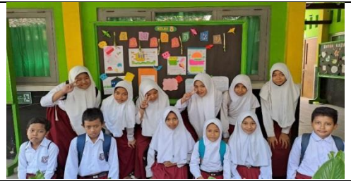
Pengenalan platform literasi dan numerasi