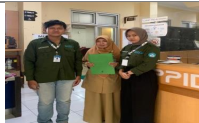
Senin 11 juni 2023 , penyerahan laporan akhir kedinas pendidikan Yogyakarta.