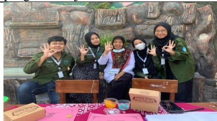
Kebersamaan dengan salah satu guru SD Dahromo saat kegiatan lomba mewarnai dan saat menjadi panitia perlombaan