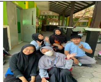
Bersama Guru Pamong ketika sedang melaksanakan kerja bakti di sekolah SD Dahromo.