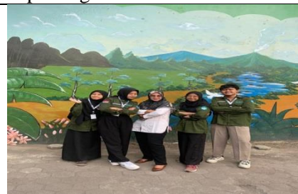
Bersama Guru Pamong