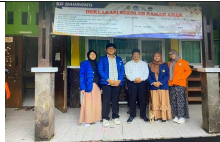
Selasa 21 Feb 2023 survei lapangan ke sekolah SD Dahromo dan Berkoordinasi dengan kepala sekolah setempat.