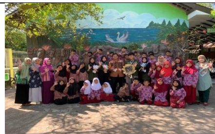
Foto bersama dengan para guru, DPL, dan siswa-siswi SD Dahromo saat penarikan,