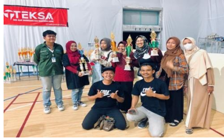
Sabtu 3 Juni 2023 mendampingi para siswa/i untuk perlombaan drum band dan mendapatkan juara 1 umum kemudian berfoto bersama guru dan pelatih ekstrakurikuler di SD Dahromo.