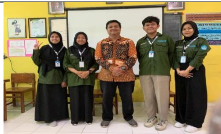
Dokumentasi Dosen pembimbing Lapangan ketika saat penarikan ataupun setelah pemaparan hasil pelaksanaan program kerja