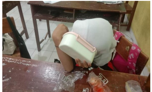
Kelas Membaca dan Menghitung