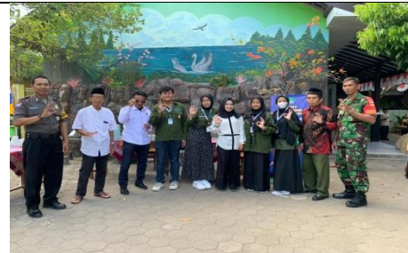
Rabu, 31 Mei 2023 membuat kegiatan lomba mewarnai tingkat tk yang diakan di SD Dahromo, kemudian berfoto dengan pemangku kepentingan sekolah