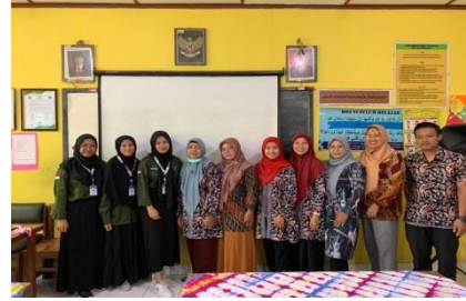
Foto Bersama Saat pemaparan program kerja yang akan dilaksanakan di SD Dahromo