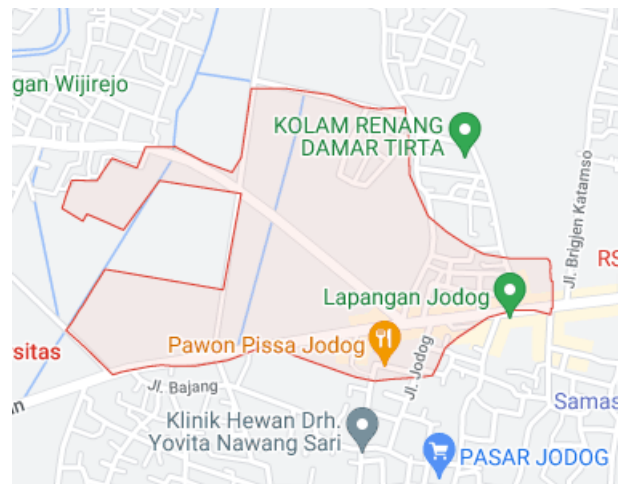
Gambar 1.1 Wilayah Geografi Padukuhan Jodog

Gilangharjo merupakan salah satu desa di Kecamatan Pandak, Bantul, Daerah Istimewa Yogyakarta, Indonesia. Dilansir dari pranala resmi dari kalurahan Gilangharjo, desa ini memiliki luas \pm 726 hektare dan terdiri dari 15 Dusun serta 91 RT. Jumlah penduduk Desa Gilangharjo pada tahun 2017 sebanyak 17025 jiwa terdiri dari 5.500 kepala keluarga. Padukuhan Jodog merupakan salah satu padukuhan yang berada di kalurahan Gilangharjo, kapanewon Pandak, kabupaten Bantul.