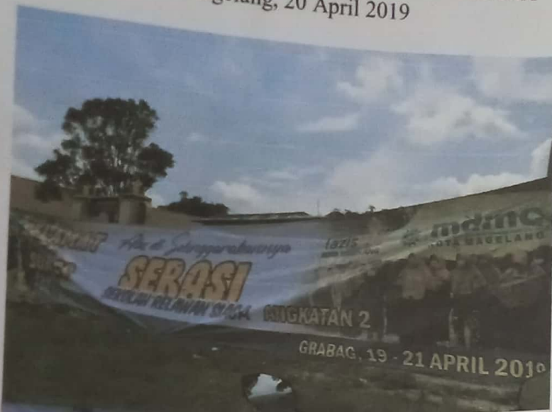
FOTO KEGIATAN SEKOLAH RELAWAN SIAGA Magelang, 20 April 2019