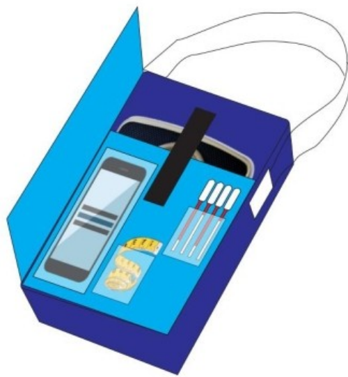
Gambar 6 : Perspektif