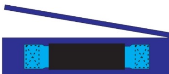
Gambar 5 : Tampak Atas