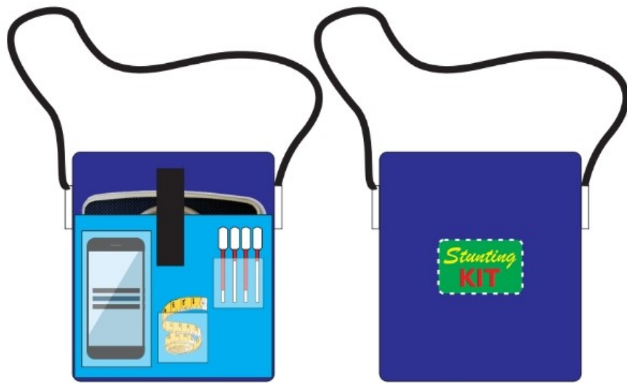
Gambar 1 : Tampak Depan