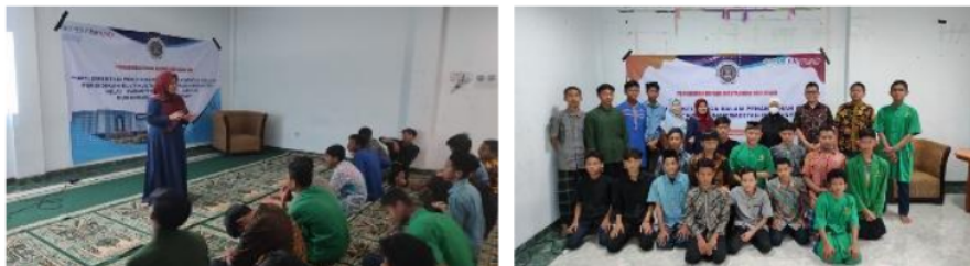
Gambar 1 Kegiatan Ceramah dan Diskusi Tentang Kenakalan Remaja

Kegiatan pengabdian kepada masyarakat ini dilakukan pada tanggal 20-21 Oktober 2022 di Aula Panti Asuhan Muhammadiyah Yogyakarta. Edukasi kenakalan remaja di Panti Asuhan Muhammadiyah dilakukan dengan cara ceramah tatap muka menggunakan media power point dan diskusi (lihat Gambar 1). Selain itu, sasaran pengabdian masyarakat ini juga diberikan materi berupa video yang berisi tentang cara penanggulangan kenakalan remaja. Hasil pengabdian kepada masyarakat terlihat ada peningkatan pengetahuan remaja tentang cara mengidentifikasi dan serta uapa pencegahannya sebesar 21% (Gambar 2).