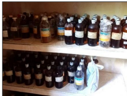
Gambar 2. Kondisi lemari asam di SMA A

disesuaikan dengan jenis dan sifat bahan (Anggraeni et al., 2013). Bahan-bahan percobaan sebagian tidak disimpan di dalam laboratorium biologi, namun disimpan di laboratorium kimia, sehingga ketika akan menggunakannya harus ke laboratorium kimia. Kondisi lemari asam yang ditemukan berdasarkan observasi yang dilakukan dalam kondisi tidak baik, pada SMA A ditemukan lemari asam yang pintunya sulit tertutup (Gambar 2) karena tekanan dari bahan kimia terlalu besar yang disebabkan karena bahan-bahan kimia sudah kadaluwarsa tidak dikelola dengan baik dan tetap disimpan bersama dengan bahan-bahan yang masih baru. Penyimpanan bahan-bahan kimia kadaluwarsa hendaknya dipisahkan dengan bahan yang belum kadaluwarsa, diperlukan penyimpanan sementara pada kompartemen rak terpisah dari bahan-bahan kimia yang masih bisa digunakan (Sulman & Irfan, 2016; Wulandari et al., 2022). Bahan-bahan kimia kadaluwarsa yang disimpan di lemari asam tersebut termasuk dalam golongan bahan berbahaya dan beracun dan berpotensi menimbulkan kontaminasi terhadap bahan lain dan membahayakan bagi pengguna laboratorium.