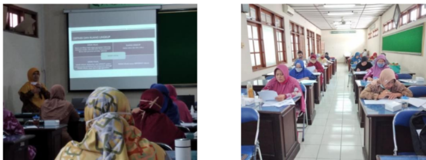
Gambar 1. Pelaksanaan pelatihan sistem jaminan halal