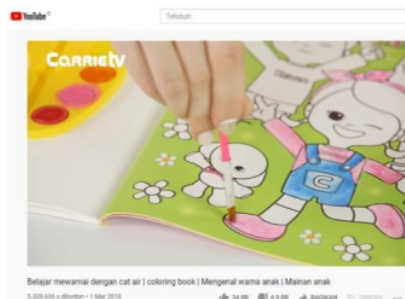
Gambar 2. Aktivitas mewarnai pada channel Carrie TV

Penyaji pada tayangan channel Carrie TV terkadang mengucapkan kata-kata baru untuk menjelaskan konten aktivitas anak-anak yang ditayangkan. Dengan menyaksikan tayangan tersebut, anak-anak dapat belajar tentang hal baru secara interaktif baik secara mandiri maupun dengan pendampingan orang tua. Multimedia interaktif dianggap dapat meningkatkan aspek psikomotorik siswa khususnya pada keterampilan menyimak melalui proses belajar secara efektif (Rohmanurmeta, 2018). Dengan demikian, secara bersamaan anak-anak dapat menerima manfaat dari tayangan pada channel Carrie TV berupa pengalaman belajar dan bermain, serta pemerolehan bahasa dalam bentuk ujaran (dengaran) kata baru. Kata-kata baru tersebut dapat diujarkan oleh anak-anak ketika beraktivitas dan bermain bersama teman lain di rumah atau di sekolah. Berikut salah satu tayangan aktivitas mewarnai pada channel Carrie TV ditunjukkan pada Gambar 2.