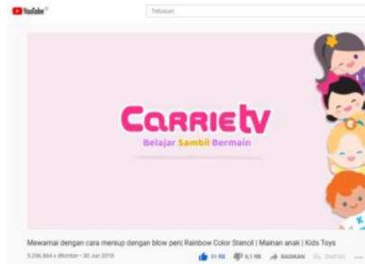
Gambar 1. Tayangan channel Carrie TV dengan tagline “Belajar sambil Bermain”

1 Tagline channel Carrie TV ditunjukkan pada Gambar 1.