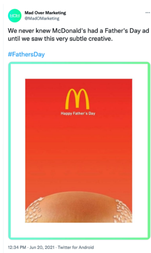
Gambar 2 Poster McDonald's Seri Father's Day