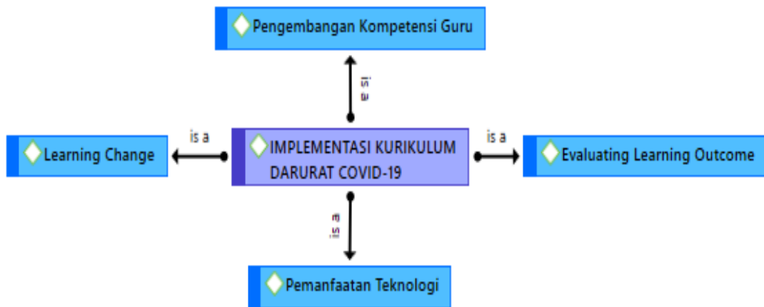
Gambar 2. Hasil Analisis Data Implementasi Kurikulum Darurat Berbantuan Software

Berdasarkan data-data lapangan yang sudah dikumpulkan di atas, selanjutnya data-data yang terkumpul dianalisis dengan menggunakan software berbantuan Atlas.ti versi 8. Gambar 1 merupakan hasil analisis data kualitatif implemementasi kurikulum darurat covid-19.