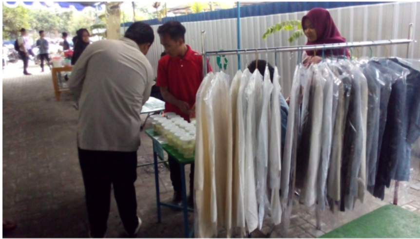
Gambar 7. Bazar UAD