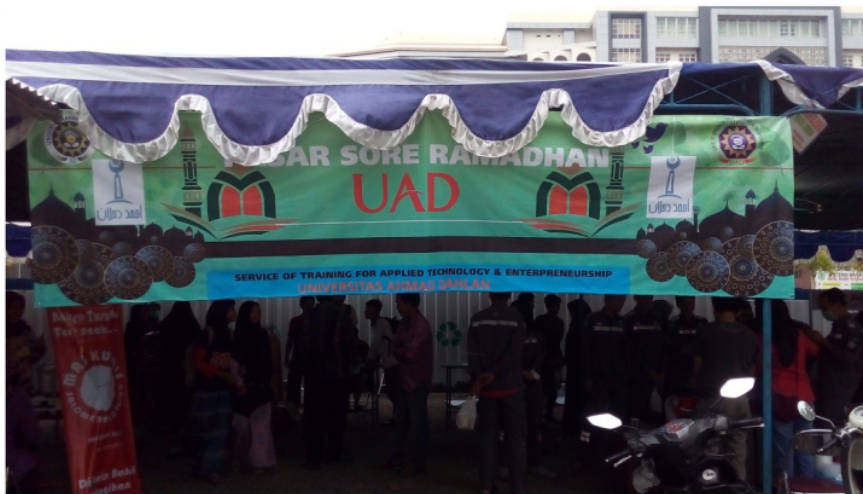
Gambar 8. Pasar Sore Ramadhan 2018