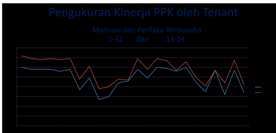
Gambar 2 Analisis Pre Post Terhadap Motivasi dan Perilaku Wirausaha Tenant PPK