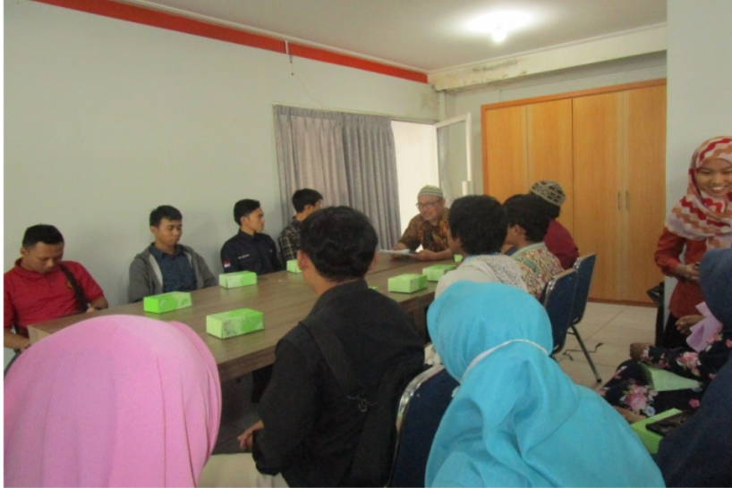
Gambar 5. Pengkondisian Tenant