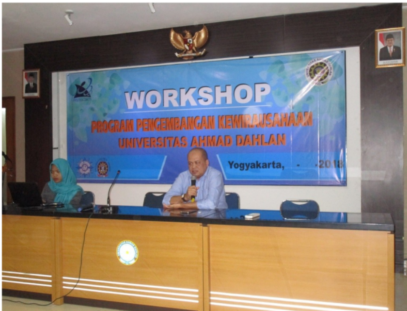
Gambar 6. Seminar pengembangan jaringan bisnis dan motivasi