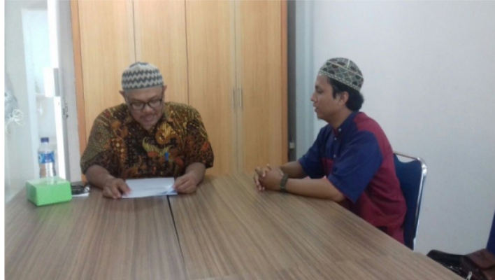
Gambar 3. Wawancara