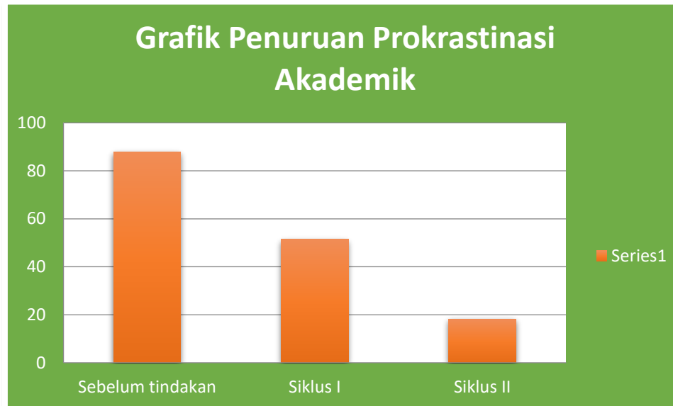
Grafik 2. Penurunan Prokrastinasi Akademik