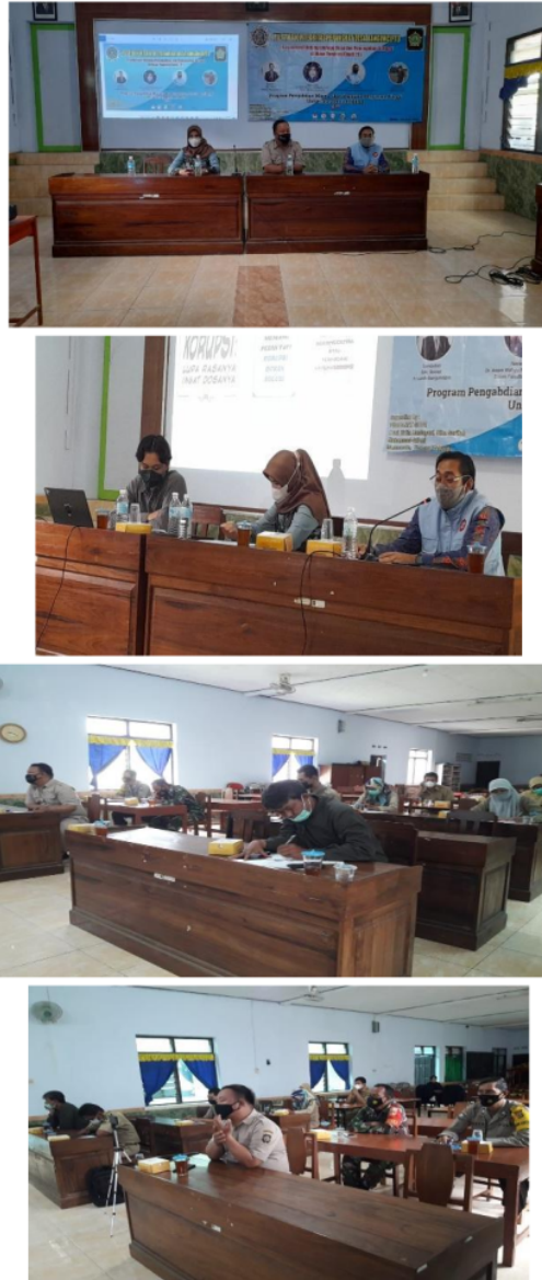
Gambar 4. Pelaksanaan kegiatan