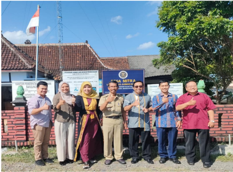
Gambar 2. Tim Pengabdian foto bersama dengan Lurah dan Pimpinan Ranting Muhammadiyah di depan plang desa mitra UAD-Banguncipto yang terpasang di depan balai desa Banguncipto

Kalurahan Banguncipto merupakan salah satu desa binaan Universitas Ahmad Dahlan yang sering digunakan oleh dosen dan mahasiswa untuk pengabdian pada masyarakat (Iin Narwanti, 2018). Selanjutnya Tim Pengabdian melakukan studi pendahuluan, observasi dan wawancara baik kepada Lurah dan Ketua PRM Banguncipto untuk melakukan analisis situasi permasalahan prioritas mitra di lokasi pengabdian. Gambar 2 menunjukkan proses analisis situasi hingga mencapai kesepakatan program kegiatan antara Tim Pengabdian desa mitra.