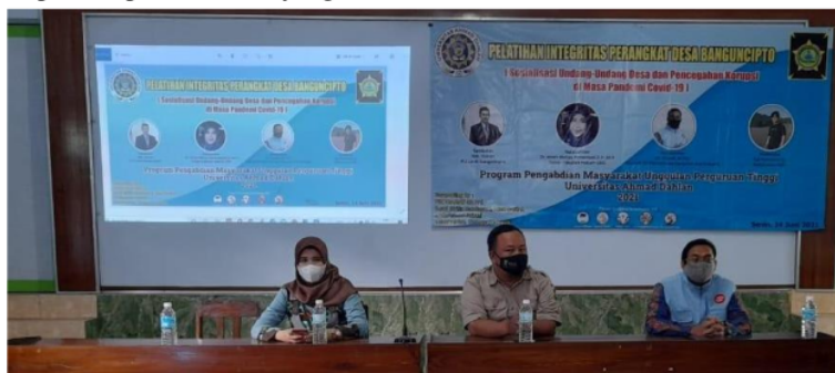
Gambar 5. Penyuluhan Rencana aksi

rencana aksi yang menjadi aksi nyata para Perangkat Desa Banguncipto dalam pelatihan integritas perihal pilihan lurah yang akan mereka laksanakan.