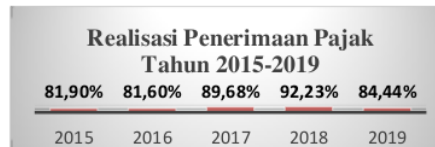
Gambar 1. Realisasi Penerimaan Pajak tahun 2015-2019.

Sampai saat ini, sumber penerimaan negara yang terbesar masih bersumber dari pajak. Hal ini ditunjukkan pada tahun 2020, penerimaan negara yang berasal dari sektor pajak sebesar 83,54 persen (www.kemenkeu.go.id, 2020). Walaupun, pajak sebagai sumber penerimaan negara terbesar akan tetapi hal ini belum tentu mendorong masyarakat untuk membayarkan pajaknya. Hal ini ditunjukkan dengan realisasi penerimaan pajak yang selalu tidak pernah mencapai target. Data realisasi penerimaan pajak disajikan pada gambar 1.