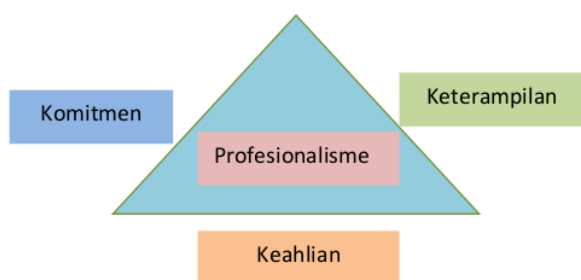
Gambar 2. Hubungan antara Profesionalisme dengan Keahlian, Keterampilan, Dan Komitmen Kerja

Sri Minarti mengutip pendapat Imam Al-Ghazali terkait profesionalisme pendidik seperti pada Gambar 2, yaitu (Minarti, 2016): a) Sifat terpenting yang perlu dimiliki seorang guru adalah kasih sayang; b) Pendidik harus menjadi pengarah yang baik; c) Pendidik hendaknya menggunakan cara yang simpatik, halus dan tidak mengandung unsur negatif seperti makian, cercaan, kekerasan; d) Pendidik harus terampil; e) Mengakui adanya perbedaan potensi peserta didik.