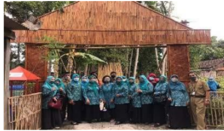
Gambar 13. Kunjunga Pokja IV. PKK DIY