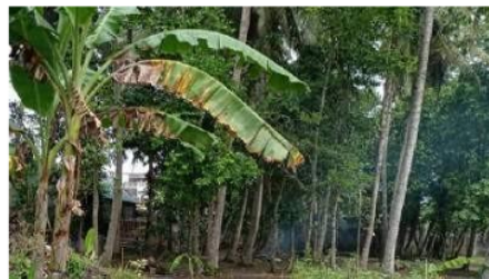
Gambar 11. Penampakan Sebelum Kegiatan Setelah kegiatan PKM-UAD. Lab. Murtigading saat ini sudah digunakan sebagai Lab. Pembelajaran pengelolaan sampah bagi masyarakat. Gambar.4.