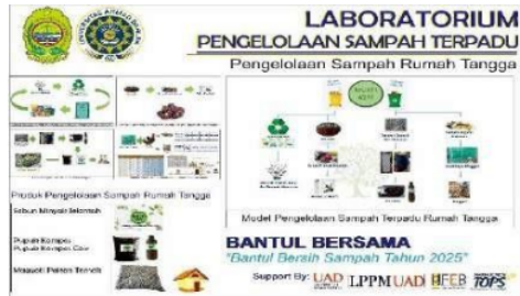
Gambar 7. Model Pengelolaan Sampah Terpadu