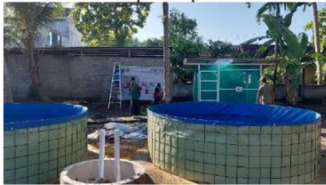
Gambar 8. Kandang BSF Maggot