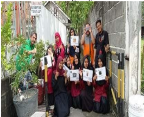
Gambar 4. Pembuatan Lab. Pengelolaan Sampah Terpadu