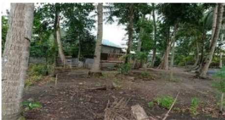
Gambar 10. Penampakan Sebelum Kegiatan Setelah kegiatan PKM-UAD. Lab. Murtigading saat ini sudah digunakan sebagai Lab. Pembelajaran pengelolaan sampah bagi masyarakat. Gambar.4.

Dampak sosial pelaksanaan pengabdian ini adalah adanya peningkatan pengetahuan masyarakat mengenai pengelolaan sampah terpadu. Selain itu, masyarakat di Murtigading memiliki gambaran secara nyata mengenai pengelolaan sampah terpadu ditingkat rumah tangga. Adapun hasil dari pengabdian ini adalah, Desa Murtigading terpilih menjadi percontohan Keluarga Tanggap Bencana Peduli Lingkungan secara nasional dan mendapat perhatian dari Po.11. IV PKK DIY sebagai model pengelolaan sampah terpadu. Hasil dari dampak kegiatan dapat dilihat pada gambar dibawah ini.