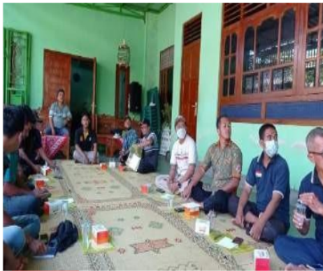
Gambar 2. Dokumentasi Kegiatan Dukuh Se-Murtigading

Kegiatan diawali dengan kegiatan pelatihan yang dilakukan oleh Tim PKM dari UAD bersama dengan Mahasiswa pada Ikatan Mahasiswa Muhammadiyah FEB dan DLH Bantul. Dengan para Dukuh 13 yang ada di Desa Murtigading tentang Maggot dan Pengelolaan Sampah. Kegiatan pelatihan dapat dilihat pada gambar di bawah ini