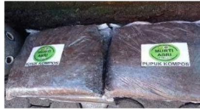
Gambar 15. Hasil Daur Ulang Sampah Organik