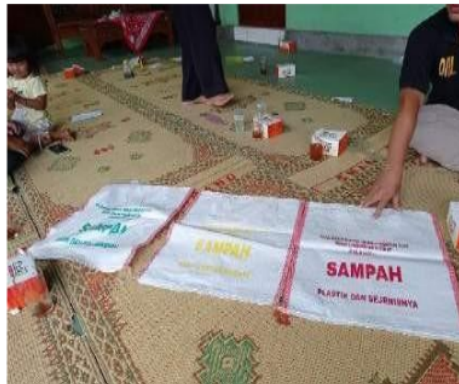
Gambar 3. Media Pelatihan