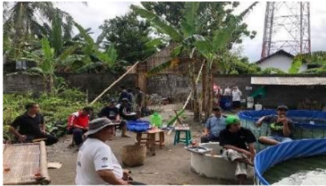
Gambar 12. Pelatihan Pengelolaan Sampah bersama masyarakat.