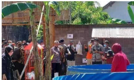
Gambar 6. Lab. Sampah Terpadu