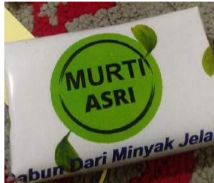
Gambar 5. Contoh Produk Eco Enzim (Sabun Jelantah)