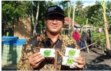
Gambar 14. Hasil Daur Ulang Minyak Jelantah