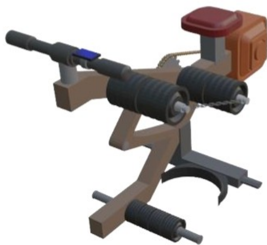
Gambar 6 : Perspektif