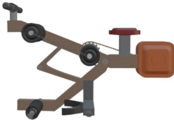
Gambar 4 : Tampak Samping Kiri