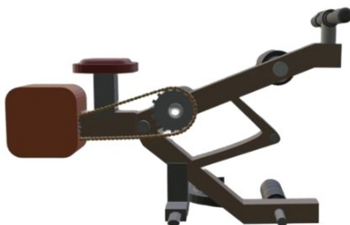
Gambar 3 : Tampak Samping Kanan