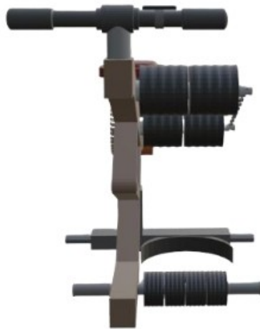
Gambar 1 : Tampak Depan