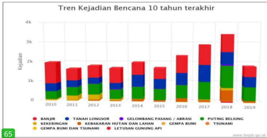
65 Grafik 1: Tren kejadian bencana 10 tahun terakhir (2010-2019)