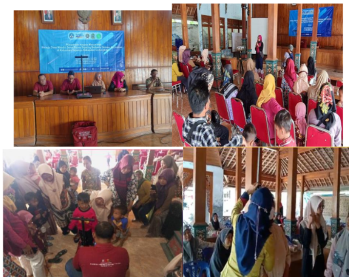
Gambar 3. Kegiatan Pelatihan dan Sosialisasi

Untuk mengetahui tanggapan pengguna terhadap inovasi teknologi berupa timbangan digital ini dilakukan evaluasi teknologi tepat guna dengan menggunakan instrumen Software Usability Scale (SUS). Instrumen SUS ini dikembangkan oleh John Brooke (Brooke, 1996) yang bertujuan mengetahui kebergunaan sebuah perangkat lunak. Namun karena Tas Stunting Kit ini adalah serangkaian modifikasi timbangan digital dan aplikasi Android maka responden difahamkan bahwa ini menjadi serangkaian teknologi yang 17 uji kebergunaannya. SUS ini terdiri dari 10 pertanyaan, seperti ditunjukkan pada Tabel 1.