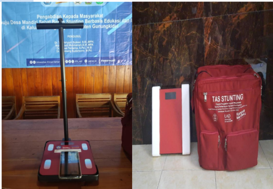
Gambar 1. Tas Stunting Kit

Pengembangan teknologi tepat guna yang diberi nama Tas Stunting Kit ini sebagai inovasi teknologi untuk membantu mencegah terjadinya stunting. Timbangan digital dimodifikasi untuk dapat terhubung ke tablet Android melalui bluetooth dan dikemas dalam sebuah tas yang memudahkan kader kesehatan membawa dalam kegiatan Posyandu, seperti ditunjukkan pada Gambar 1.