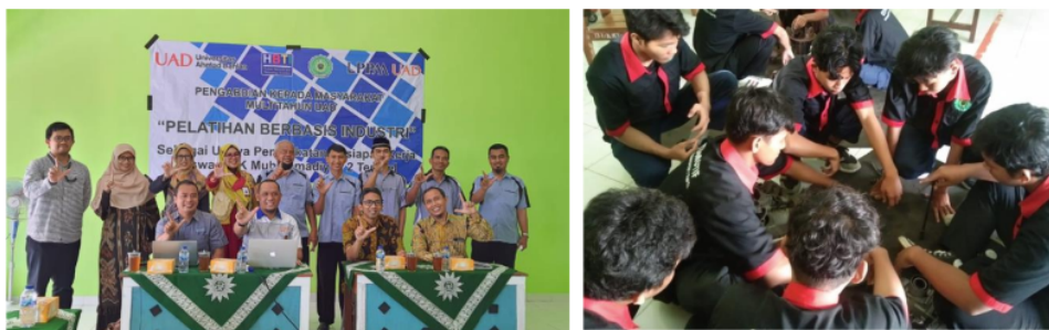
Gambar 1. Kegiatan Pelatihan dan Pendampingan Sikap, Pengetahuan, Keterampilan dan Budaya Kerja

Dengan demikian, penting bagi SMK untuk memastikan bahwa siswa menguasai kompetensi keahlian dan mengembangkan budaya kerja yang baik. Dengan adanya kompetensi yang kuat dan budaya kerja yang positif, siswa di SMK akan memiliki landasan yang kokoh untuk meraih kesuksesan dalam dunia kerja serta berkontribusi secara positif dalam lingkungan industri dan masyarakat secara lebih luas. Upaya meningkatkan pemahaman guru dan siswa tentang kesiapan kerja berbasis industri serta peningkatan kompetensi dan kualitas dalam bidang yang dipilih akan menjadi langkah maju dalam mempersiapkan generasi muda untuk masa depan yang cerah. Dengan sinergi antara pendidikan vokasional berkualitas, pembentukan budaya kerja yang baik, serta dukungan dan bimbingan yang tepat, diharapkan lulusan SMK Muhammadiyah 2 Tempel dapat lebih siap dan kompeten untuk menghadapi dunia kerja yang semakin kompetitif dan dinamis.