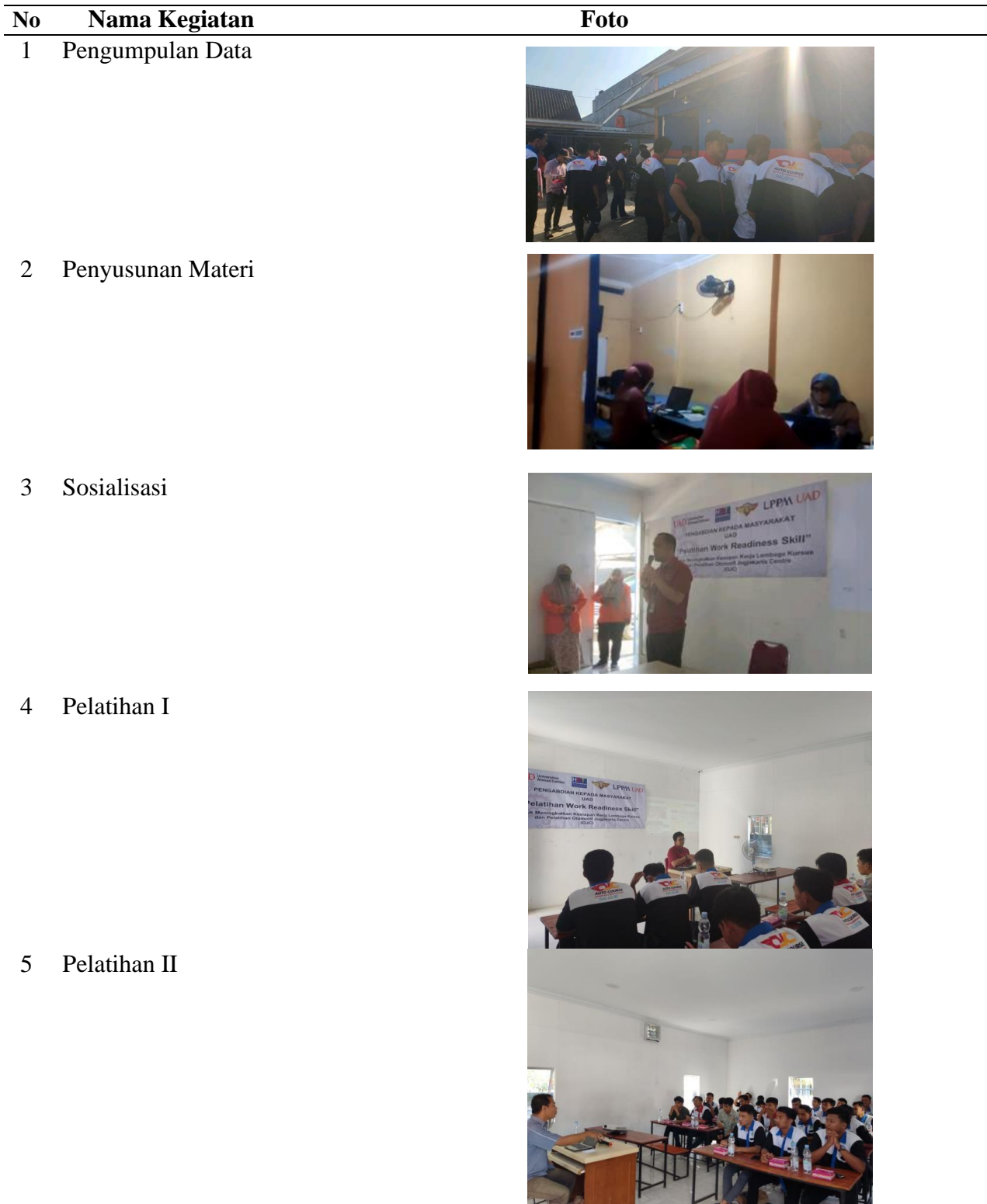
Tabel 1. Keterlaksanaan PkM

Hasil dari sebelum dan sesudah perlakuan pelatihan terlihat ada kenaikan skill yang dimiliki oleh siswa dan instruktur pada LKP tersebut. Hal itu dapat dilihat pada tabel 2 berikut ini: