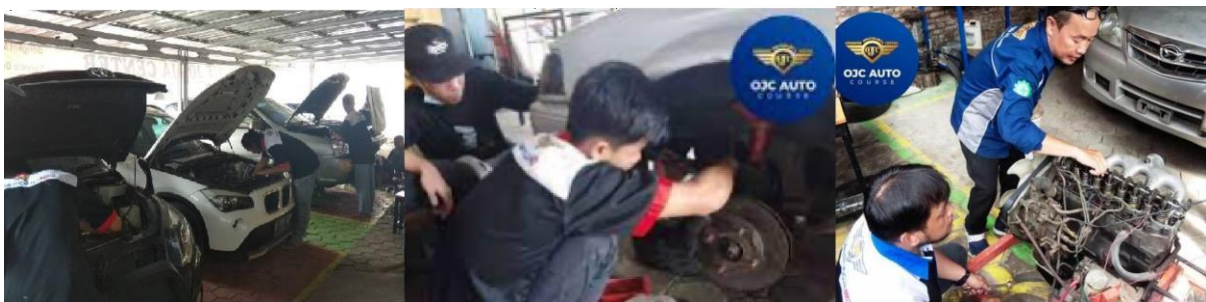
Gambar 1. Kegiatan Otomotif Jogjakarta Centre (OJC)

Otomotif Jogjakarta Centre (OJC) merupakan perusahaan yang bergerak di bidang otomotif yang saat ini tengah berkembang ke sistem digitalisasi sesuai tuntutan revolusi industri 4.0. OJC memiliki beberapa sub usaha yang meliputi bengkel mobil (perbaikan kendaraan ringan), kursus otomotif dan pembuatan media pembelajaran otomotif serta penjualan spare part otomotif. Khusus sub usaha kursus otomotif yang disebut OJC Auto Course setiap tahun telah meluluskan lebih dari 100 siswa yang mayoritas lulusan SMA/SMK yang berasal dari seluruh pelosok negeri. OJC Auto Course memiliki 3 cabang yang dibagi menjadi 3 kompetensi keahlian yaitu OJC Auto Course sepeda motor, OJC Auto Course Kendaraan ringan, dan OJC Auto Course Mekatronika (sistem kontrol elektronika). Sub usaha yang kedua adalah OJC Auto Service. OJC Auto Service bergerak dibidang perbaikan kendaraan ringan yang saat ini telah memiliki lebih dari 3 cabang yang tersebar di seluruh Indonesia. Sub usaha ketiga adalah OJC Auto Spare Part yang bergerak dalam distribusi pemasaran spare part.