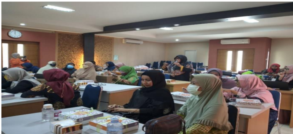
Gambar 4. Suasana pelatihan digital marketing dan pengemasan