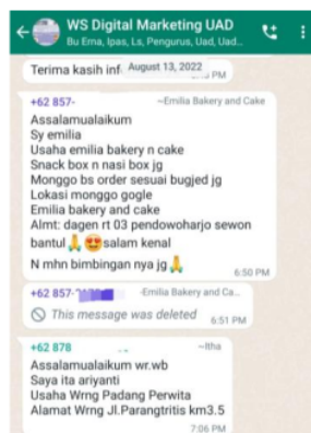
Gambar 7. Pendampingan melalui grup whatsapp

Untuk dapat melihat efektivitas dari pembekalan yang dilakukan dalam kegiatan pengabdian ini maka dilakukan pengukuran pengetahuan yang dilakukan sebelum dan sesudah dilaksanakan pelatihan digital marketing dan pengemasan. Hasil uji statistik dapat dilihat pada tabel 1.