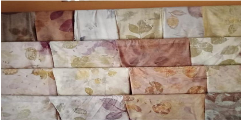
Gambar 1. Salah satu produk bisnis anggota IPAS Bantul berupa batik ecoprint

bagi anggota IPAS, mengingat tingginya tuntunan pasar dalam penggunaan jaringan online saat bertransaksi.