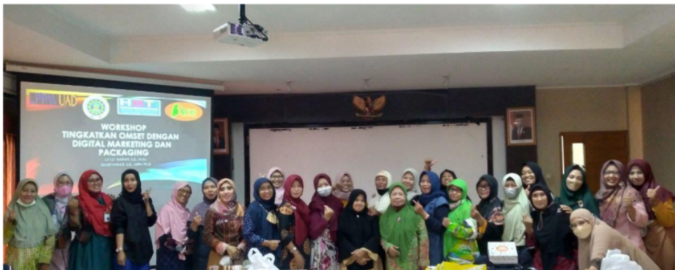
Gambar 5. Peserta pelatihan digital marketing dan pengemasan

Peserta juga mendapatkan tutorial pemasaran melalui marketplace dan media sosial yang dikemas dalam bentuk video, sehingga dapat dipelajari kembali ketika peserta melakukan praktek. Untuk memastikan bahwa peserta memahami materi dengan baik, tim pengabdian mendampingi peserta melalui grup Whatsapp .