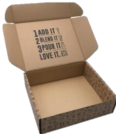
Gambar 2. Contoh kemasan ramah lingkungan

Selain permasalahan mengenai pemasaran, anggota IPAS juga memiliki permasalahan dalam hal mendesain kemasan untuk produknya. Kemasan memegang peranan penting terkait pilihan konsumen terhadap produk. Topik yang terkait dengan keberlanjutan atau pembangunan berkelanjutan cenderung semakin banyak dibahas seiring dengan perubahan sosial budaya dan sosial serta kesadaran akan perlindungan lingkungan. Banyak orang yang semakin memperhatikan pola konsumsinya dan mulai mengurangi sampah dari pola konsumsi tersebut semaksimal mungkin. Oleh karena itu, banyak orang memilih produk dengan kemasan yang ramah lingkungan.