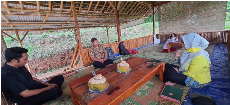
Gambar 1. Sosialisasi dan koordinasi program pengabdian kepada masyarakat

Kegiatan pengabdian dilakukan dengan pelatihan, TOT, praktek, pendampingan dan pemberdayaan masyarakat yang dilaksanakan selama bulan Juni 2022 hingga bulan Oktober 2022. Koordinasi dilakukan untuk mensosialisasikan Kembali program dan melakukan diskusi dengan mitra untuk program. Koordinasi dilakukan dengan metode online dan offline. Online dilakukan dengan WA dan offline dilakukan dengan pertemuan di daerah Tawang, yaitu lokasi yang nantinya akan dikembangkan sebagai bagian dari centra kuliner di Desa Ngoro-oro. Dilaksanakan pada tanggal 15 Agustus 2022 dengan dihadiri ketua BUMKAL dan pendamping kabupaten. Dalam kegiatan ini disampaikan harapan untuk pendampingan mitra untuk mengembangkan Desa Wisata Ngoro-oro terutama centra kuliner, rest area, dan Pasar Ngoro-oro.