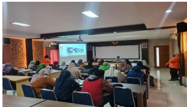
Gambar 4. Suasana pelatihan digital marketing dan pengemasan

Pengukuran pengetahuan dilakukan sebelum dan sesudah dilaksanakan pelatihan digital marketing dan pengemasan (Gambar 4) untuk mengetahui peningkatan pemahaman pengurus UKM Bangkit terkait materi pelatihan. Hasil pengukuran dapat dilihat pada Tabel 1 berikut.