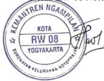
H.M Fauzi Noor Afschochi