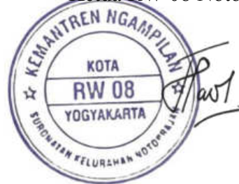
H.M Fauzi Noor Afschochi