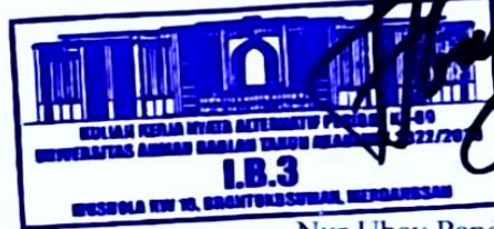
Nur Ubay Pangesda Haji