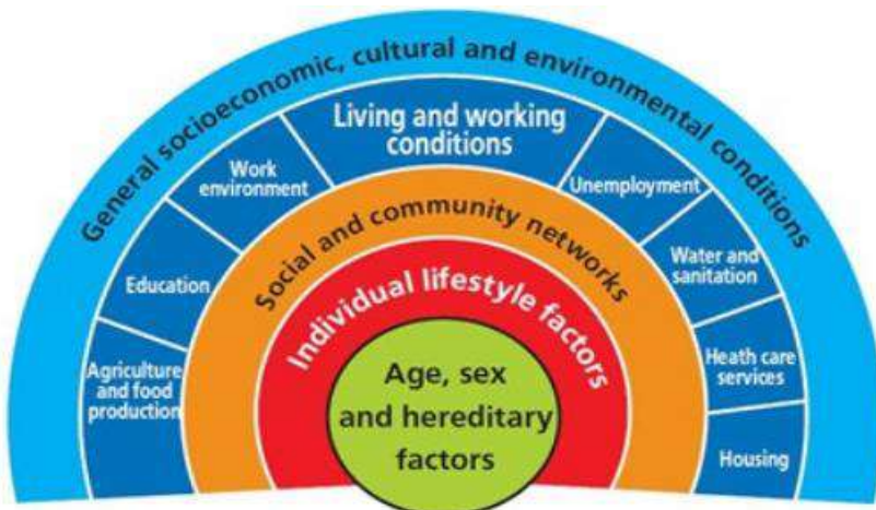
Gambar 1 Model determinan eko-sosial kesehatan