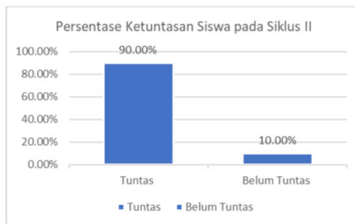
Gambar 2. Persentase Ketuntasan Siswa pada Siklus II

Apabila dibandingkan dengan KKM, maka banyaknya peserta didik yang melampaui KKM dan yang belum mencapai ketuntasan tersaji pada Gambar 1 berikut.