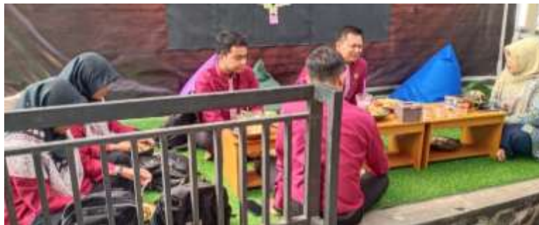
Gambar 2. Perencanaan Teknis Asesmen oleh Psikolog Tim Pengabdian