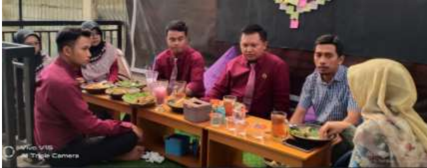
Gambar 1. Kordinasi Kepala SMP Muhammadiyah Muntilan dan Tim Pengabdian

Tahapan kordinasi awal pelaksanaan pengabdian dilakukan bersama psikolog ahli untuk menentukan langkah strategis dan prosedur yang tepat agar program pengabdian berupa penguatan mental dan karakter islami pada siswa SMP Muhammadiyah Muntilan dapat berjalan efektif. Kordinasi Bersama psikolog ahli dilakukan secara terbatas antara tim pengabdian, kepala sekolah, wakil kepala sekolah bidang kesiswaan, dan guru bimbingan dan konseling (BK) (Gambar 5) agar orientasi dan sasaran program pengabdian dapat dicapai dengan prosedur yang tepat.