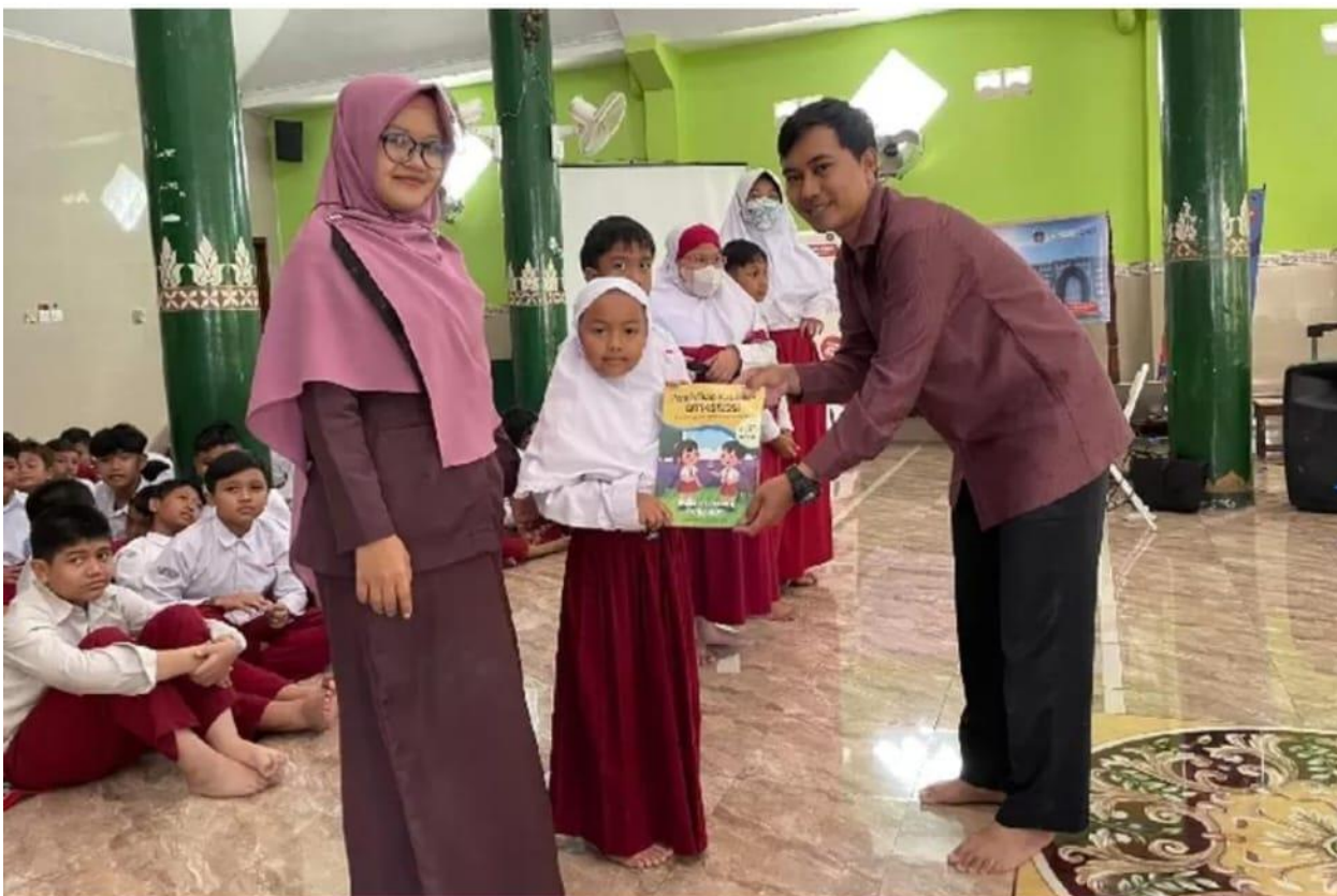
Seru dan Asyik! Pelajar SD Ikuti Sosialisasi Prototipe Literasi Antikorupsi Bersama Dosen UAD