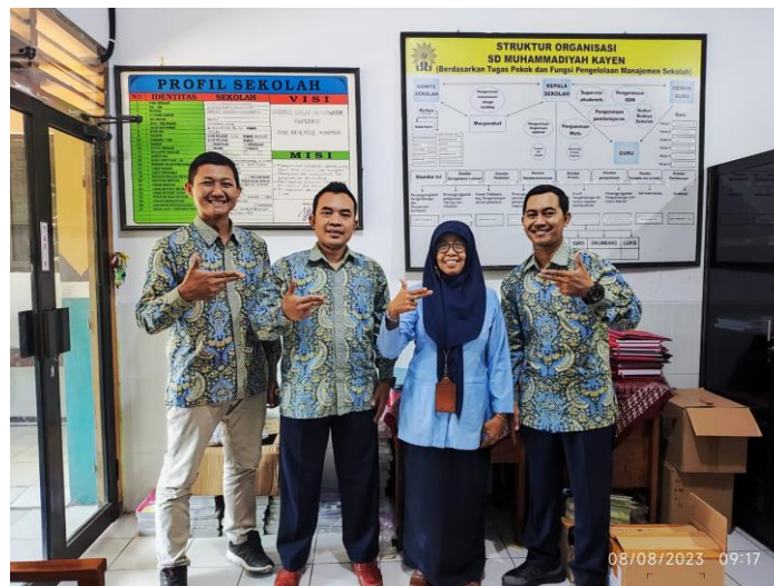
Gambar 1. Observasi untuk identifikasi permasalahan Mitra Pengabdian kepada Masyarakat

Gambar 1 diatas menunjukkan bahwa sebelum melakukan kegiatan pengabdian kepada masyarakat perlu adanya koordinasi untuk menentukan identifikasi permasalahan mitra sehingga bersama-sama untuk menentukan solusi permasalahannya. Hasil dari observasi dan koordinasi awal menemukan kesepakatan bahwa perlu adanya sosialisasi, penyuluhan dan pendampingan dalam rangka Gerakan literasi antikorupsi di SD Muhammadiyah Kayen Condongcatur.