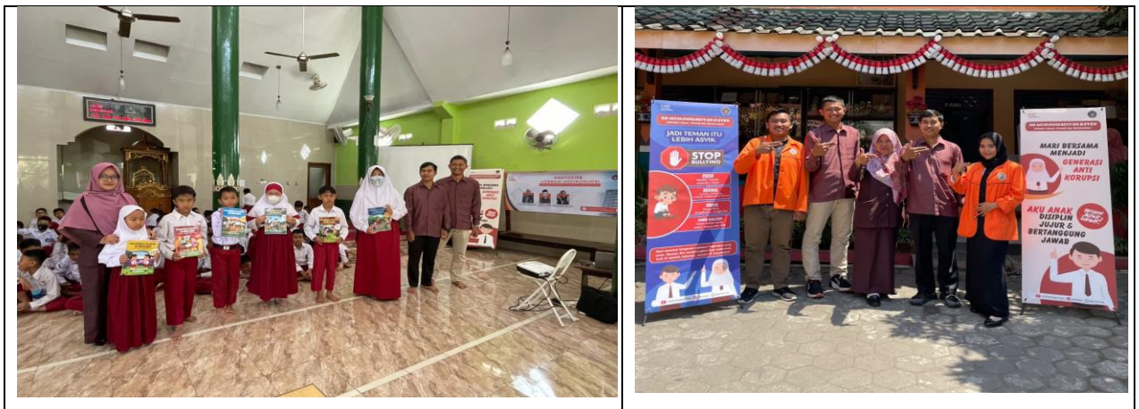
Gambar 4 Penyerahan Buku Pendidikan Karakter Antikorupsi dan Poster Literasi Antikorupsi

Gambar 4 menggambarkan upaya keseriusan dalam gerakan literasi antikorupsi bukan hanya sekedar sosialisasi berupa materi saja namun perlu didukung oleh buku-buku tentang pendidikan antikorupsi. selain itu juga merupakan upaya habituasi literasi antikorupsi agar sekolah dasar muhammadiyah kayen Condongcatur dapat menjadi prototipe sekolah integritas.