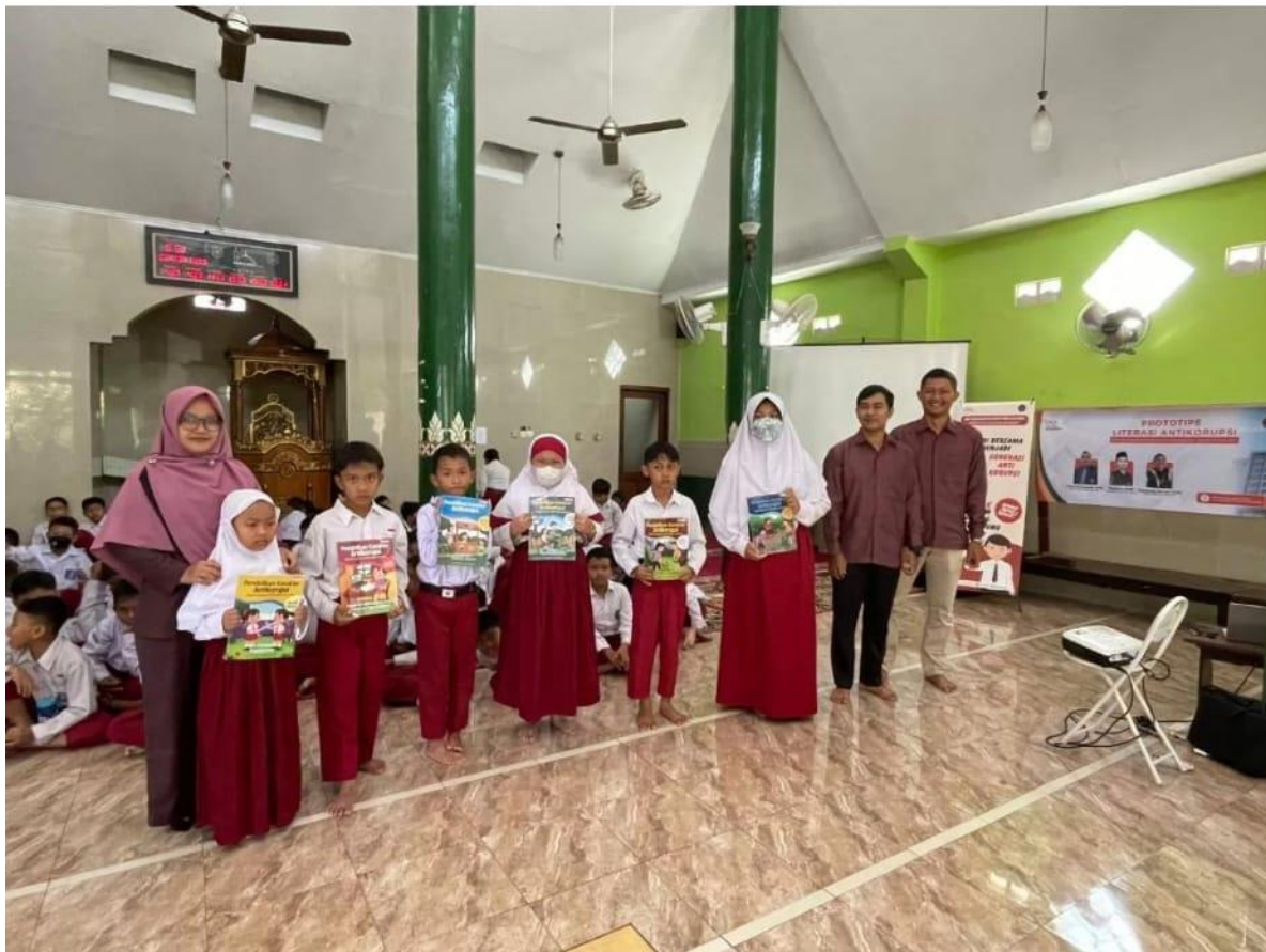
Pelajar SD Ikuti Sosialisasi Prototipe Literasi Antikorupsi Bersama Dosen UAD

Ivan Aditya Kamis, 24 Agustus 2023 | 13:14 WIB