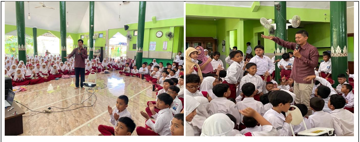
Gambar 3. Kegiatan sosialisasi dan penyuluhan Literasi antikorupsi

Gambar 3 menunjukkan semangatnya anak-anak yang mengikuti kegiatan penyuluhan literasi antikorupsi. Kegiatan ini diikuti oleh seluruh kelas 1 sampai kelas 6. gerakan ini perlu juga didukung dengan buku-buku dan poster-poster yang mengkampanyekan nilai-nilai antikorupsi.