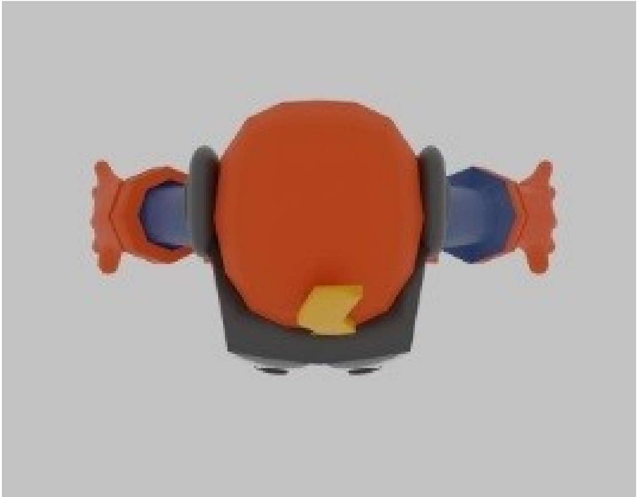
Gambar 2 - Tampak Atas