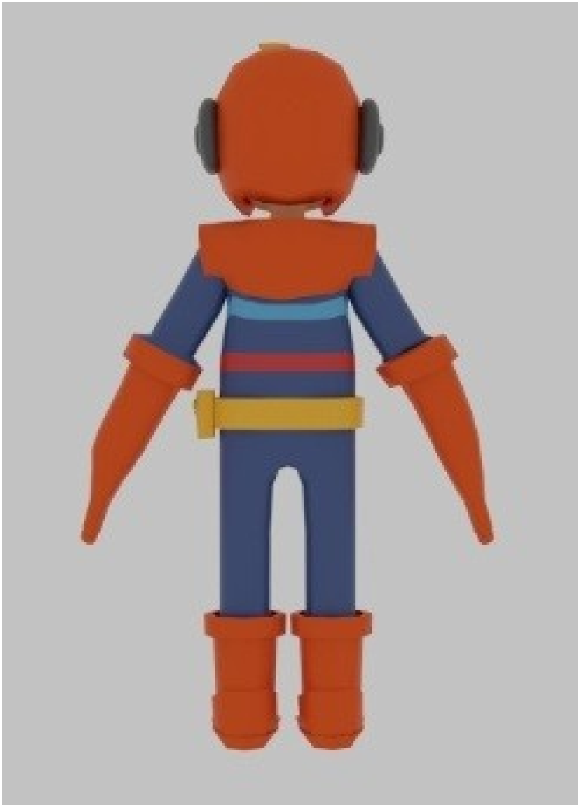
Gambar 5 - Tampak Belakang