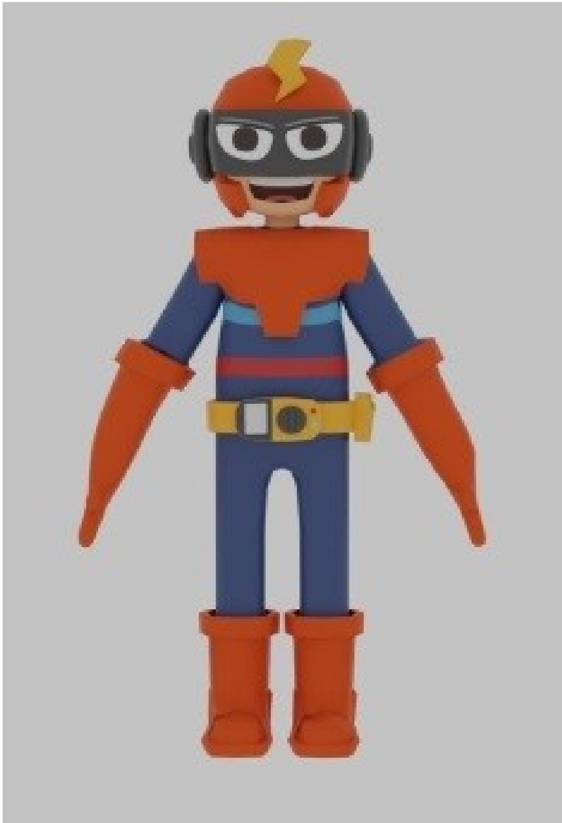
Gambar 4 - Tampak Depan