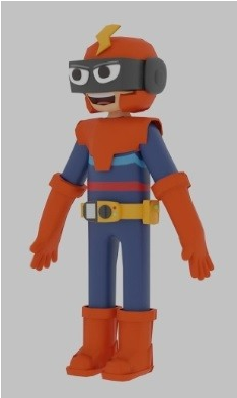
Gambar 1 - Tampak Perspektif