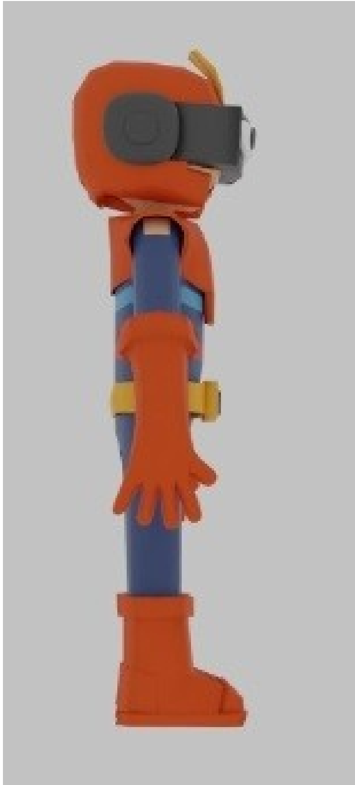
Gambar 7 - Tampak Samping Kanan