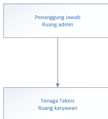
Gambar 2.1 Struktur organisasi