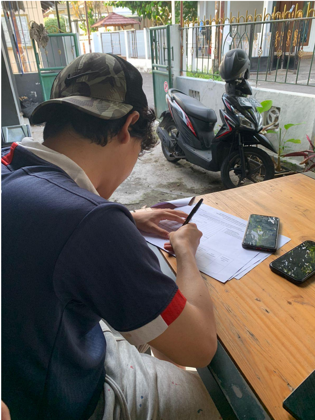
Gambar 5.8 Bukti kegiatan