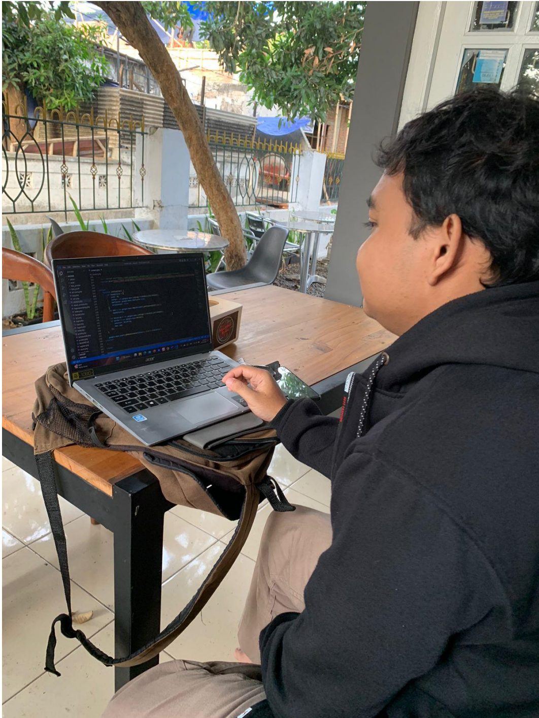
Gambar 5.9 Bukti kegiatan